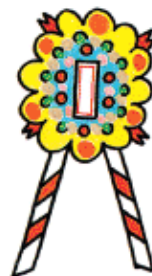
落成式・開店祝の花輪