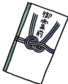
秘書等が代理で出席する 場合の葬式の香典