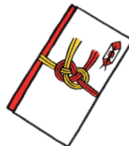
秘書等が代理で出席する 場合の結婚祝