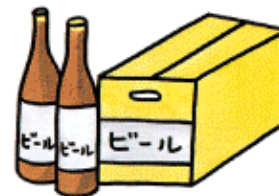
町内会の集会や旅行などの 催物への寸志や飲食物の差入