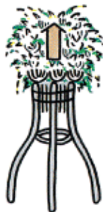
葬式の花輪・供花