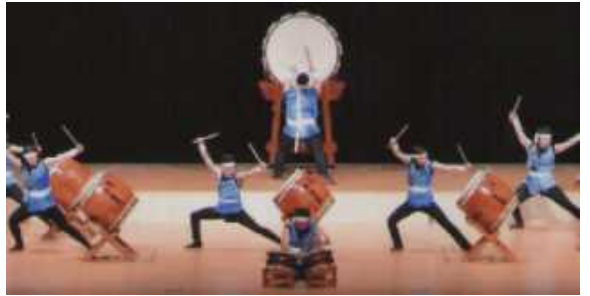
第12回関八州太鼓まつり