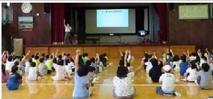
シミュレーターを使用した広報啓発活動

「栃木県交通安全基金」は、県民一人ひとりの交通安全意識の高揚や交通マナーの向上を図り、交通事故のない安全・安心な“とちぎ”をつくるために活用されます。