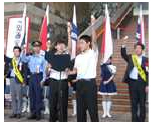
各季の交通安全県民総ぐるみ運動