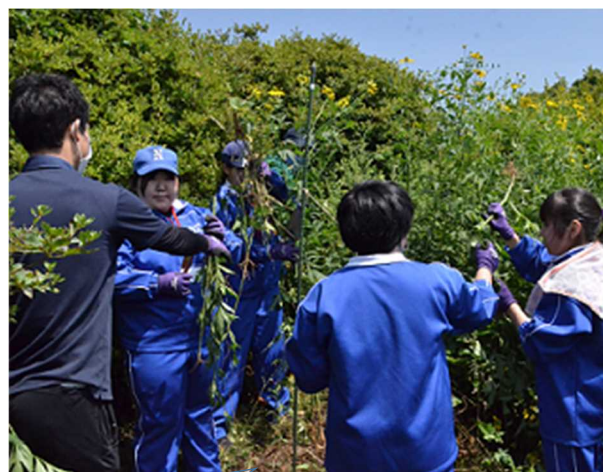
高校生によるオオハンゴンソウ駆除活動

○地元企業等と連携・協働し、地域農産物や農産物加工品の開発をととして地域ブランドの創出を目指します。