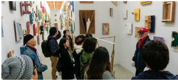
ART369 プロジェクト「美力街道—未知の駅」