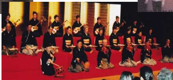
第 20 回宝生流謡曲と古典芸能の会 (宝和会)