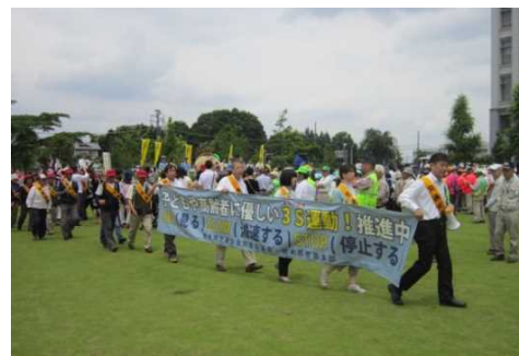
高齢者交通安全県民総ぐるみ運動 オープニングセレモニー