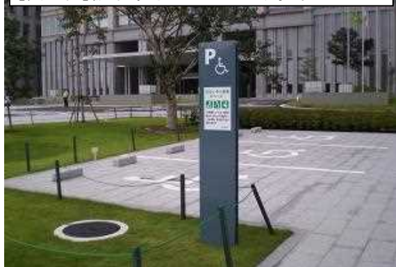
[表示例]栃木県庁のおもいやり駐車スペース

「栃木県地域福祉基金」は、県民みんなで支え合い、共に生きる福祉社会を目指し、地域福祉の充実を図るために活用されます。