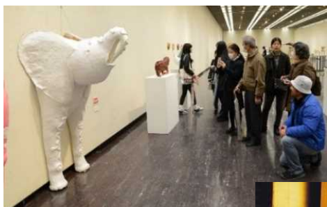
栃木県彫刻造形協会展 (学生の部) (栃木県彫刻造形協会)

第 28 回ふれあいコンサートinYAITA (ふれあいコンサートinYAITA 実行委員会)