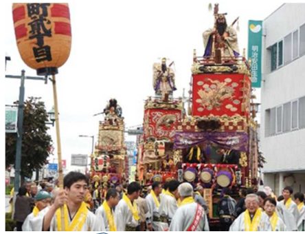
とちぎの三国志「山車人形」まつり実行委員会