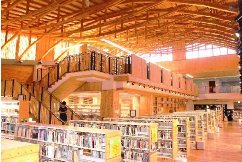
公共施設の木造化

これからの10年間は、5,000ヘクタールの皆伐後の植栽などに取組み、森林の若返りを図ります。