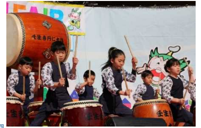
みぶの日実行委員会