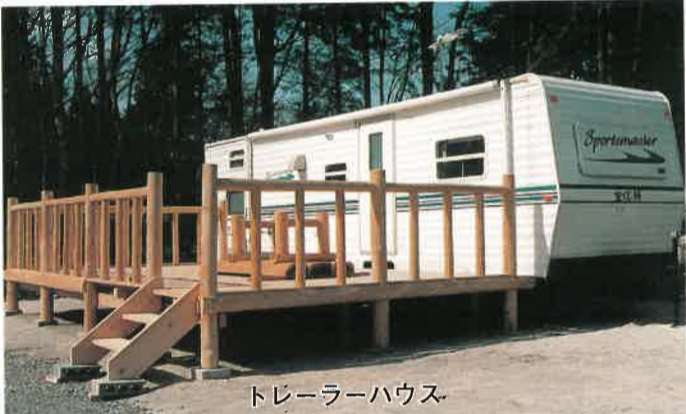
トレーラーハウス

大谷川の清流や緑豊かな自然、世界遺産への登録が予定される日光二社一寺などの歴史・文化遺産に囲まれた滞りは、充実した施設とあわせ、様々なレジャーニーズに十分応えられるものと思っています。