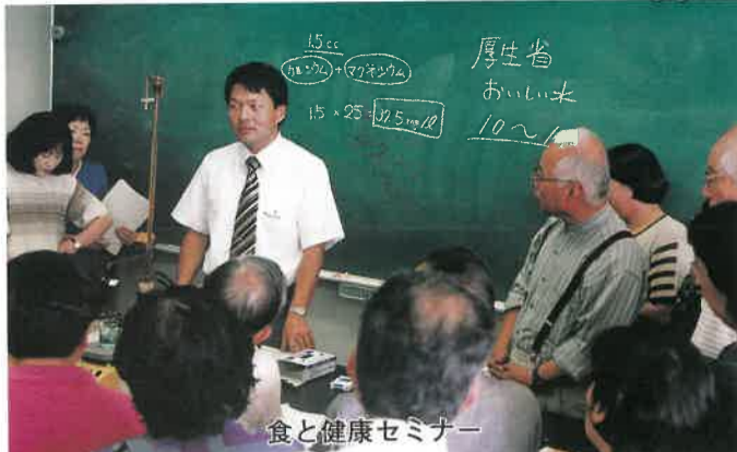
食と健康セミナー

受講者の方は、各講座会場で「学習のあゆみ」手帳を受け取り、単位を積み重ねることができ、一定の単位に達すると、学長である知事から奨励証が授与されます。