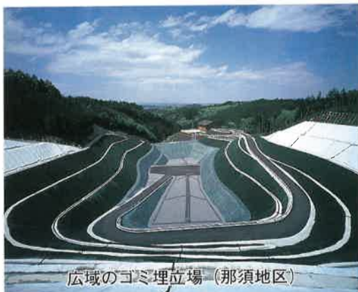
広域のゴミ埋立場(那須地区)

環境保全対策については、地球 温暖化対策推進法の制定を受け、 推進計画の策定に着手するほか、 ダイオキシンや環境ホルモンの実 態調査を行うことにしました。