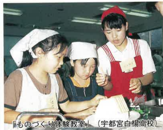
「ものづくり体験教室」(宇都宮白楊高校)

創意ある学校づくり推進など「心 の教育」推進対策費に二億八、三 〇〇万円、少年非行防止総合対策 推進事業費に二、九〇〇万円、青 少年センターの整備事業費に六、 三〇〇万円を計上しました。