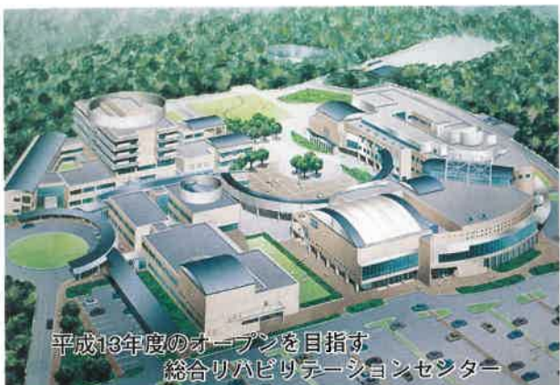
平成13年度のオープンを目指す 総合リハビリテーションセンター

平成十一年度は、県の長期計画である「とちぎ新時代創造計画三期計画」(五カ年計画)の四年目に当たることから、計画の実現に向け、各種施策を着実に推進することとしています。