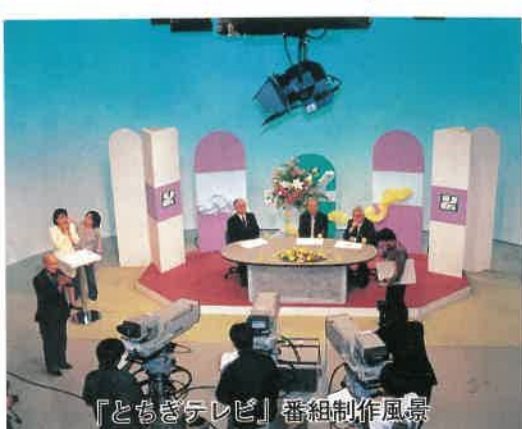
「とちぎテレビ」番組制作風景

四月一日、県民のテレビ「とち ぎテレビ」が開局しました。 県の施策や課題などを分かりや すく紹介し、県政への理解と関心 を一層深めていただけるよう、県 政情報の新たな広報媒体として積 極的に活用していきます。放送 メディア広報費(新規)として八億 円を計上しています。