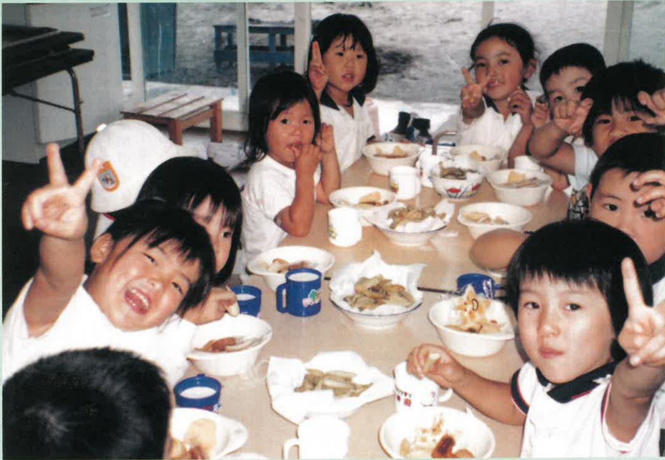
地域全体で子育て支援