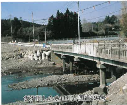
仮復旧した余笹川と国道294号

主な内容は子育て支援環境づく りに二、四〇〇万円、周産期医療 や妊産婦・乳幼児医療対策など子 どもの健やかな成長のために十四 億九千万円、子育てをしながら働 く方々を支援する環境づくりに十 四億九、六〇〇万円、子どもを育 む教育の充実と地域づくりに八億 一、二〇〇万円を計上しました。