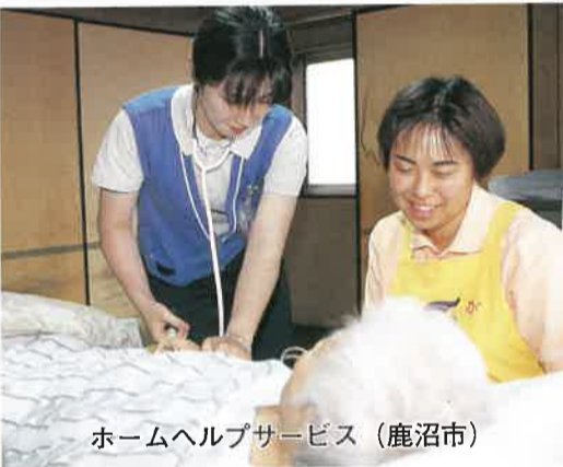
ホームヘルプサービス(鹿沼市)

高齢対策では、来年四月にスタ ートする「介護保険制度」の円滑 な導入に向け、老人ホーム等の老 人福祉施設の整備に対する助成や 各種在宅福祉サービスを拡充する ほか、市町村に対する指導・支援 を積極的に行っていきます。