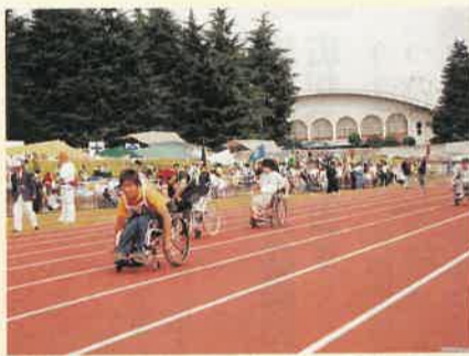
「車いす60m」のようす。応援団から選手へ熱い声援が送られました

十月十一日、県総合運動公園などを会場に、県身体障害者スポーツ大会が開催されました。開会式で、知事は「日ごろから鍛えられた成果を發揮するとともに、交流の輪を広げてください」とあいさつ。選手やボランティアなど約三千百人が参加し、陸上競技や車いすバスケットなどで気持ちのいい汗を流しました。