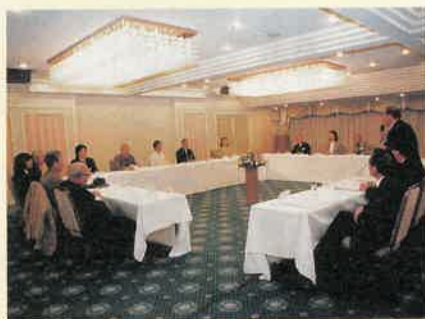
知事は「未来のとちぎづくりに向けて、忌憚のないご意見をいただきたい」とあいさつ

十月二十日、「とちぎ特使」との懇談会が東京都内で行われました。とちぎ特使は各界で活躍されている本県ゆかりの方々です。県政経営やイメージアップへの助言をいただき、とちぎの魅力や県内外にアピールしていただいています。出席した十二名の特使の代表的なご意見を紹介します。