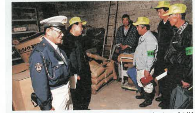
戸締まりは大丈夫? 喜連川町の自警団クライムバスターズの巡回。多発している農作物の盗難防止のため、農家の納屋をチェック