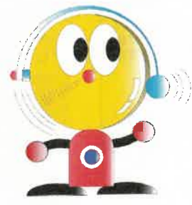
ぼうはん・ベルくん 犯罪抑止キャラクター