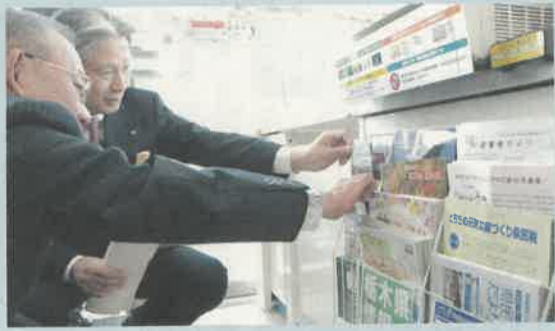
この「とちぎ県民だより」もファミリーマートのお店で毎月入手できるようになりました

十二月四日から、コンビニエンスストアの(株)ファミリーマートの県内店舗に「県政情報発信ボックス」が設置されました。これは、九月に締結された県と同社との包括業務連携協定に基づく協働事業として設置されたもので、こうした取り組みは今回が初めて。観光マップや県民サービス情報など、県民の暮らしに身近な情報を発信していきます。