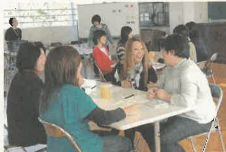
参加者からは「普段から思っていたことを声にして言えたことが良かった」「家に帰ったら子どもを抱きしめたい」との感想が

佐野市の「家庭教育支援チーム」では、小学校の就学時健診や保護者会などに出向き、親学習プログラムを行っています。親学習プログラムとは、保護者同士がさまざまなテーマに沿って、身近な出来事やデータをもとに話し合いをしながら、子どもとの接し方などを学んだ