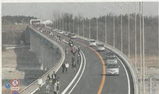
「宇都宮テクノ街道・板戸大橋」の名前は県民の皆さんの応募のなかから選ばれました