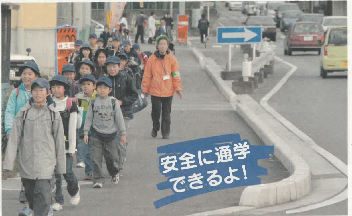
宇都宮市立城山中央小学校の通学風景/防犯や事故防止のため、「まごころサポーター」の方が見守ります

〒320-8501 宇都宮市堀田1-1-20 TEL 028-623-2192 FAX 028-623-2160 栃木県のホームページ http://www.pref.tochigi.lg.jp/