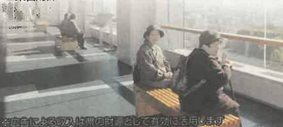
※白による視認性は県の標準として有効に活用します