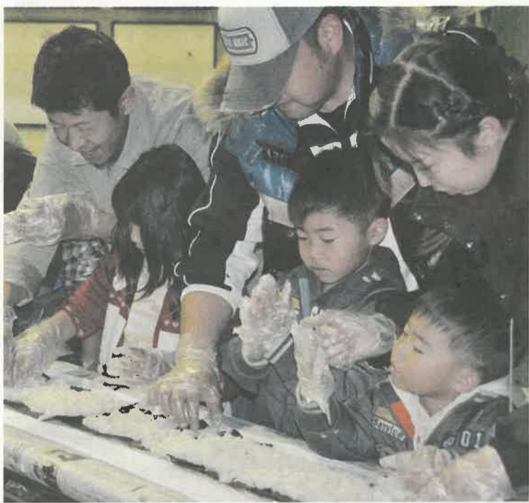
大平町で行われたオピニオンリーダー会主催の「みんなで太巻き寿司づくり」には、231名の親子が参加。上手に巻けるかどうかは、お父さんの腕のみせどころ

近年、親の過保護や過干渉、放任、育児不安やしつけへの自信喪失...など、さまざまな問題があります。県では、子育て中の親が自信を持つ