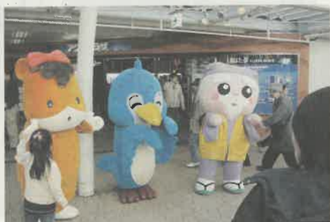
12月7日、開通を記念して三県合同で観光をPR(左から)くんまちゃん、ルリちゃん、ハッスル黄門

群馬県高崎市から栃木県を通り、茨城県ひたちなか市を結ぶ全長約一五〇キロの高速道路「北関東自動車道(愛称・北関)」。この北関の真岡ICから桜川筑西IC間が今年二十日の午後三時に開通します。宇都宮市〜水戸市の移動は今までより約三十分短縮でき、海も身近になります。また、東北道と常磐道の二つの高速道路とつながっているため、北関を通じて首都圏や東北地方との新たな連携が生まれ、観光地の活性化も期待されるほか、移動時間が短くなることから、車から排出される二酸化炭素などの削減にもなります。 さらに、高速道路は、救急 救命活動でも重要な役割を果たします。移動時の振動が少ないことから、患者さんへの負担が軽減するだけでなく、救急車内での医療活動がスムーズに行うことができるなどの、さまざまな効果があります。