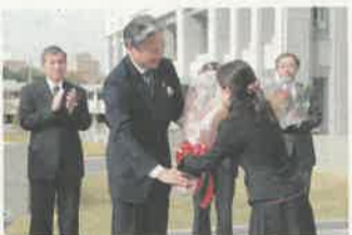
11月18日、花束を受け取り初登庁