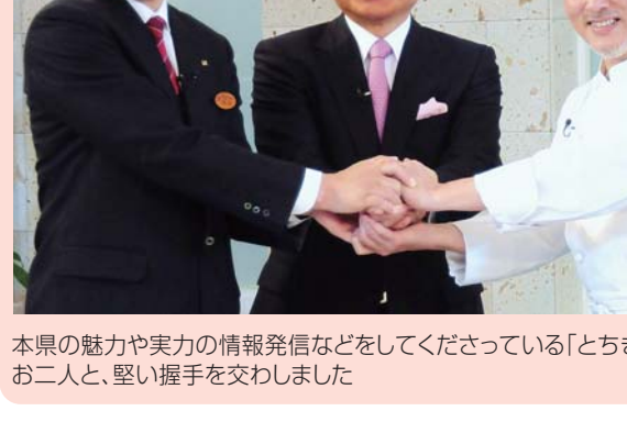
本県の魅力や実力の情報発信などをしてくださっている「とちぎ未来大使」のお二人と、堅い握手を交わしました

知事 平成24年は、ふるさととちぎの良さを県民みんながあらためて共有する、そういう1年にぜひしたいと思っています。また、今日感じた、次はどんな料理がくるのだろうというワクワク感を「とちまるショップ」でも感じていただければ、店づくりに真剣に取り組みたいと思います。お二人には、ふるさととちぎに引き続きお力添えをお願いいたします。