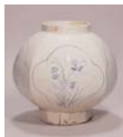
(青花磁器文面取蓋) 大阪市立東洋陶磁美術館蔵

☎028-621-3566 月曜日、1/3～13 ◎浅川伯教・巧兄弟の心と眼-朝鮮時代の美 1/14(土)～3/20(火・祝) ●朝鮮陶磁研究の第一人者、浅川伯教と、朝鮮の工芸品に関する先駆的な著作を遺した浅川巧。浅川兄弟や柳宗悦が選抜いた朝鮮時代の陶磁器や木工品をはじめ、伯教作の絵画資料や陶芸作品など約200点を通して、浅川兄弟の事跡を体系的に紹介します