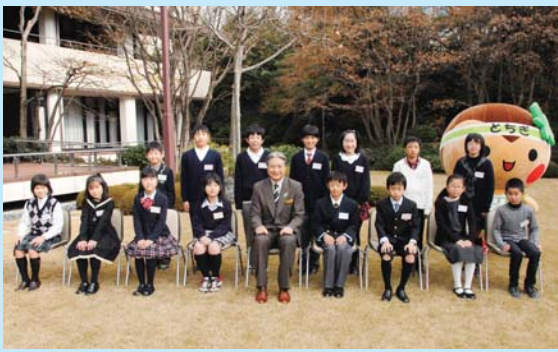
県公館で知事や、とちまるくと記念撮影する受賞者の皆さん