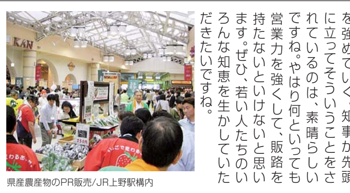
県産農産物のPR販売/JR上野駅構内

を強めていく。知事が先頭に立つてそういうことをされているのは、素晴らしいですね。やはり何と云っても営業力を強くして、販路を持たないといけないと思います。ぜひ、若い人たちのいる知恵を生かしていただきたいですね。