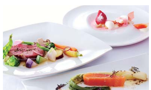
左から、とちぎ和牛、ヤシオマス、とちおとめなどの県産食材を使った料理