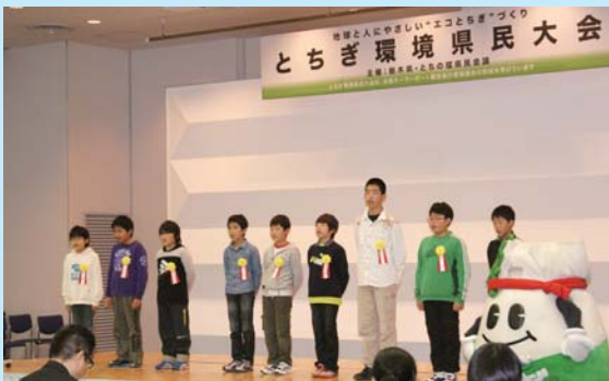
宇都宮市立峰小学校の児童による「エコとちぎ」づくり県民宣言(この事業は全国モーターボート競走施行者協議会の拠出金で実施しました)