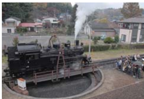
間近でSLの勇姿を見られる茂木駅のSL転車台

されており、勢いよく煙をはきながら、蒸気機関車の独特の音を響かせて力走するSLは、子どもから大人まで幅広い世代に人気です。折り返しの茂木駅では、転車台で180度回転する大迫力のSLを見ることが出来ます。宇都宮方面から真岡鐵道を利用するには、真岡行きバス路線の利用が便利です(真岡駅前または台町バス停で下車)。マイカーを問わずにSLの旅を楽しむことができます。