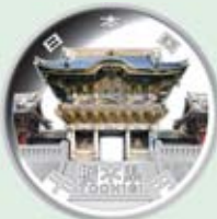
日光東照宮陽明門 直径:40mm