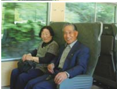
④谷あいにかかる橋を渡る「お座トロ展望列車 湯めぐり号」 ⑤展望車両に乗車されたご夫婦