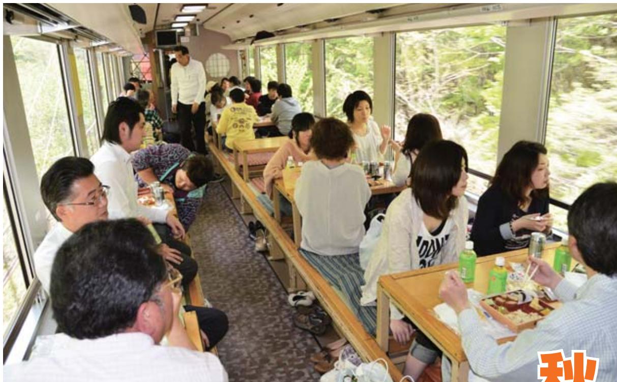
掘りごたつ風の座席でのんびりくつろげる「お座トロ展望列車 湯めぐり号」のお座敷車両