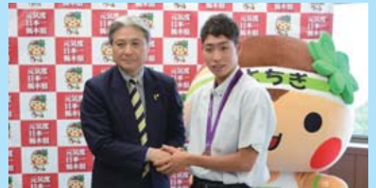
競泳男子400メートル個人メドレーで銅メダルを獲得した萩野公介選手(8月10日)「メダルを目標としていたが、本当に取れるとは思っていなかったのうれしい」と笑顔で話していました。