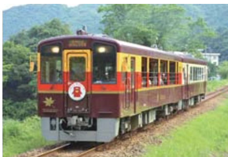
トロッコ列車の新車両「わっしー号」

100年の歴史と渓谷美 わたらせ渓谷鉄道 日光市足尾と群馬県桐生市を結び、渡良瀬川上流の谷筋に沿って走る約44キロの路線です。かつて日本一の産出量を誇った足尾銅山の銅を輸送するために、明治44年に鉄道を敷設したのがその始まり