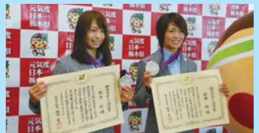
女子サッカーで銀メダルを獲得した安藤梢選手(右)と鮫島彩選手(左)(8月16日)安藤選手は「皆さんの応援で、勇気や元気をもらえた」、鮫島選手は「県民の皆さんに恩返しできた」とそれぞれ感謝の気持ちを述べていました。