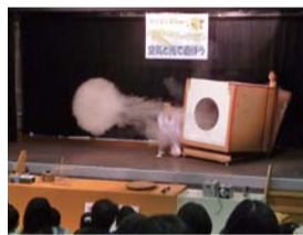
サイエンスショー

●さまざまな実験を交えたサイエンスショー ●天文台公開(4/27・29・5/4・6)や星をみる会(4/28・5/3)など楽しい催しが盛りだくさん