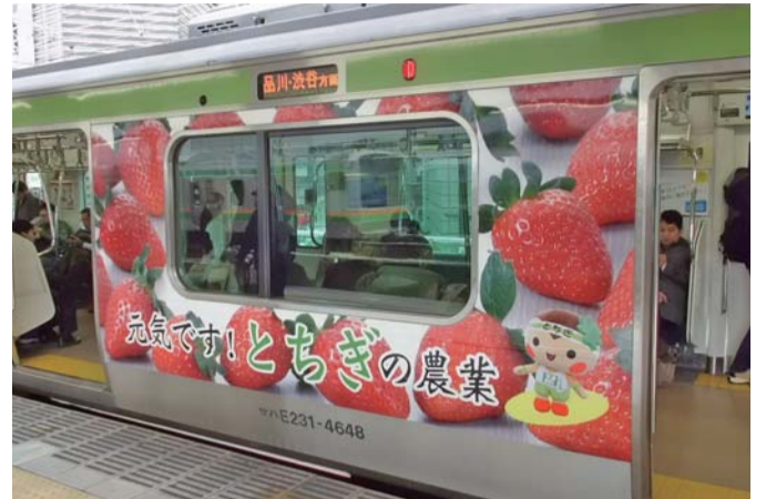
本県農産物の風評被害払拭のため、とちぎの農業をPRしたラッピング電車 (JR山手線)

今年度の一般会計予算は、7,692億2,000万円です。東日本大震災からの復興に取り組むとともに、「新とちぎ元気プラン」の重点戦略を着実に推進し、「元気度 日本一 栃木県」の実現を目指します。