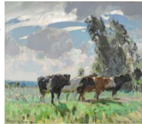
アーンスピー・ブラウン(九月の朝) 1910年代(松方コレクション旧蔵)

さらに近年再発見され、修復を済ませた旧松方コレクションのイギリス絵画2点も初公開します