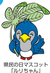
県民の日マスコット「ルリちゃん」