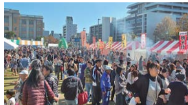
2日間で約12万8千人が訪れた昨年のグルメまつり