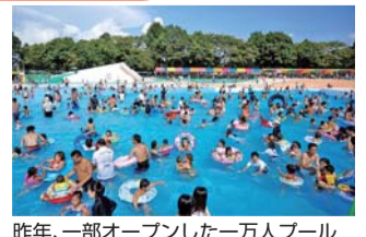
昨年、一部オープンした一万人プール