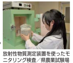
放射性物質測定装置を使ったモニタリング検査/県農業試験場