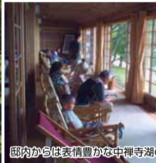
邸内からは表情豊かな中禅寺湖の風景が堪能できます