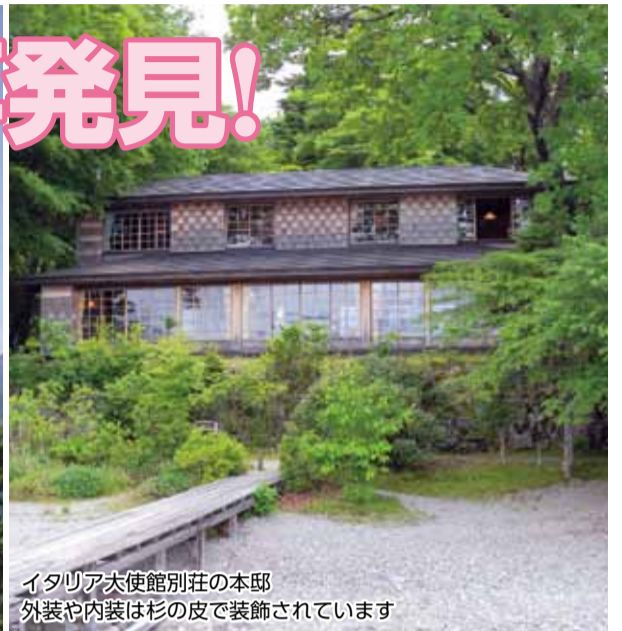
イタリア大使館別荘の本邸 外装や内装は杉の皮で装飾されています