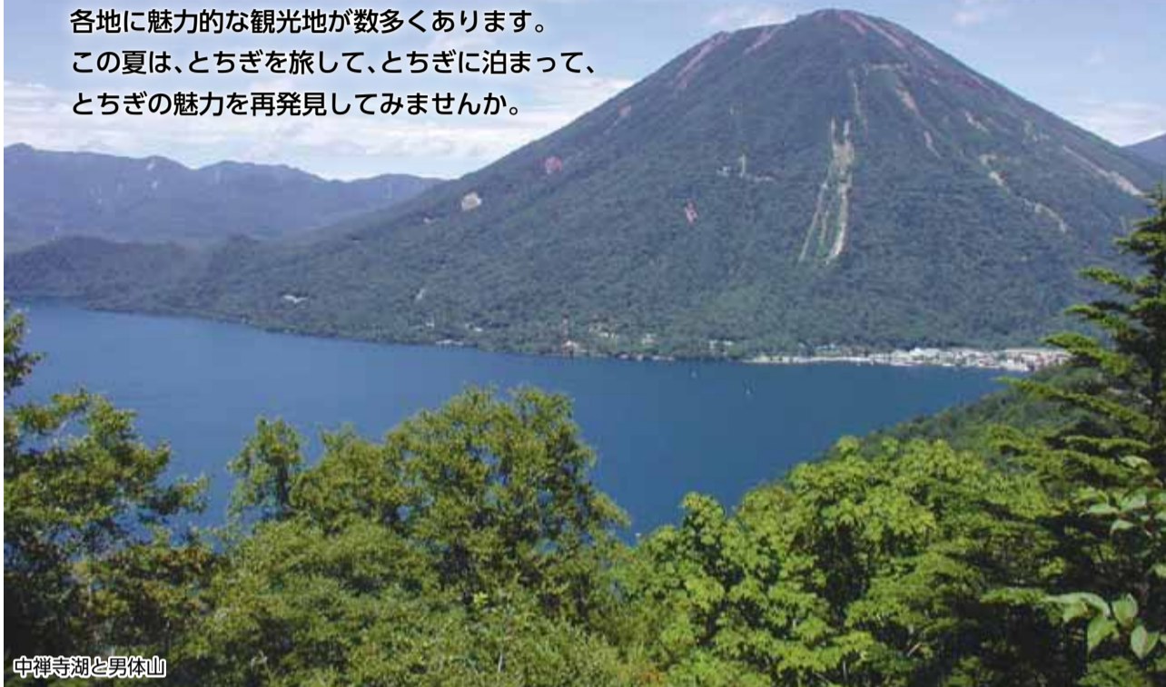
中禅寺湖と男体山

本県には避暑地として全国的にも知られる日光や那須をはじめ、各地に魅力的な観光地が数多くあります。この夏は、とちぎを旅して、とちぎに泊まって、とちぎの魅力を再発見してみませんか。