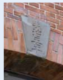
▲明治5(1872)年に開設したことを示す

栃木・茨城・群馬の3県は北関東自動車道でダイレクトに結ばれています。ちよっと足を伸ばして、お隣の県にも出かけてみませんか。3県連携による紙面交換企画として、茨城県・群馬県の情報を紹介します。