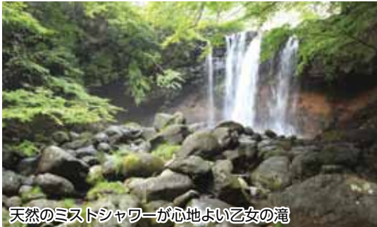
天然のミストシャワーが心地よい乙女の滝