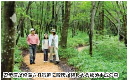
遊歩道が整備され気軽に散策が楽しめる那須平成の森