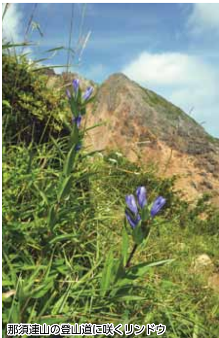
那須連山の登山道に咲くリンドウ

美しく豊かな自然に恵まれた那須地域には、那須連山の裾野に位置する高山植物の宝庫「沼ッ原湿原」や、宮内庁から環境省に移管された那須御用邸用地の一部を整備して開園した「那須平成の森」など、気軽に自然とふれあえるスポットが数多くあります。新鮮な空気を胸いっぱい吸い込みながら、のびのびと大自然の散策を楽しんで、身も心もリフレッシュできます。