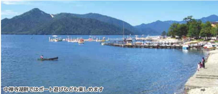
中禅寺湖畔ではボート遊びなども楽しめます