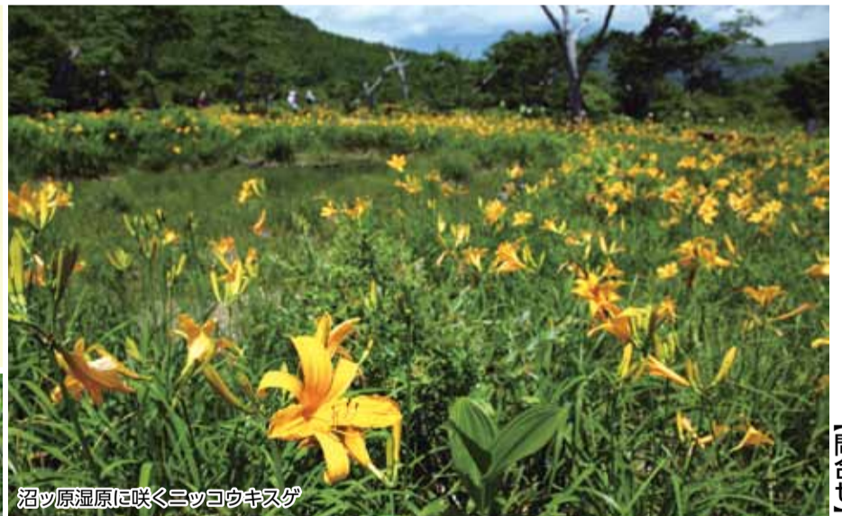
沼ッ原湿原に咲くニッコウキスゲ