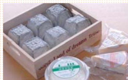
木箱に入ったヤギのチーズと牛のチーズ

牛乳の消費も売り上げも伸び悩む中、自家生乳を加工し付加価値を付けた製品を作りたいという思いから、ナチュラルチーズ作りを始めました。ヤギのチーズは、今年の9月から11月までJALの国際線ファーストクラスの機内食にも採用されました。