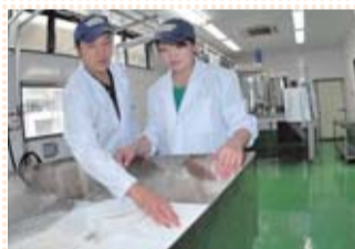
搾りたての生乳からチーズが作られます

牛やヤギに餌を与える時間を規則的にすることで、ストレスがたまらないようにしています。餌は、与える直前に作ったものを使っています。また、搾りたての生乳を専用の管を通してチーズ工房まで送り、空気に触れない新鮮な生乳をチーズの原料として使っています。