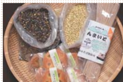
そば粉を使ったタルト、そば乾麺、そばの実

「自分で作ったものは自分で値段を付けて売りたい」という思いから、そばの生産から加工・販売までの経営に取り組んでいます。自家栽培のそばを加工し、そば粉として商品化しました。そば粉以外に、そば粉を使ったお菓子や生麺・乾麺も作っています。