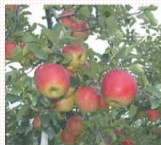
無袋栽培で育てられたりんご

主産地の青森では、開花から180日程度で収穫しますが、こちらでは210日程度かけてりんごが完熟するのを待ちます。りんごに袋をかけない無袋栽培で育てているので、太陽の恵みを受けたおいしいりんごが育ちます。また、ペットボトルにりんごジュースや焼酎を入れた罠を木に吊りさげ、害虫をおびき寄せ捕獲することで減農薬で栽培しています。