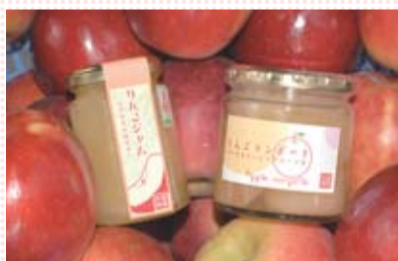
素材の味を生かしたジャムとコンポート

営んでいる観光果樹園をPRするためのアイテムとして、また、りんごジュース以外にも手土産になるようなものがあると良いなと思い、りんごのジャムやコンポート、乾燥果実などの商品開発・販売を始めました。キウイ・梅・ブルーベリーのジャムも自家生産しています。