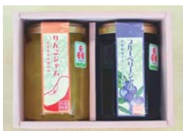
りんごジャムとブルーベリージャム