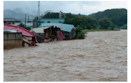
洪水により壊れた建物