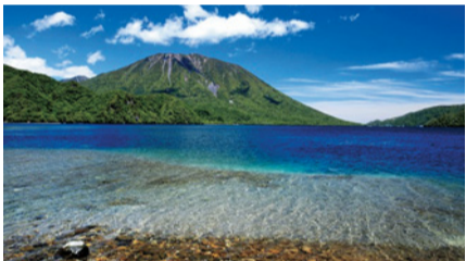
問県環境保全課 ☎028-623-3189 ※いずれも応募方法などは問い合わせを

◎うちのコ見て見てコンテスト ●自慢のペットの写真を募集 定9/2(金) 問動物愛護指導センター ☎028-684-5458 ◎障害者に対する理解促進を図る作品 ①心の輪を広げる体験作文②障害者週間のポスター ●対象：①小学生以上②小・中学生 定いずれも9/5(月) 問県障害福祉課 ☎028-623-3490 ◎統計グラフ栃木県コンクールの作品 ●対象：小学生以上 定9/5(月) 問県統計課 ☎028-623-2242 ◎「ジュニア知事さん」作文 ●テーマ：私が知事になったらしてみたいこと ●対象：小学4～6年生 定9/7(水) 問県広報課 ☎028-623-2158 ◎奥日光清流清湖フォトコンテスト2016 ●テーマ：～奥日光～未来へつづく水辺の風景 定11/30(水)