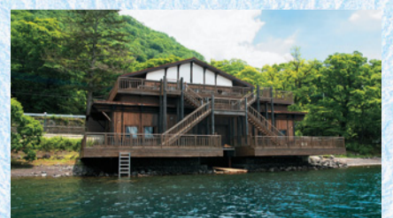
湖畔に優雅にたたずむボートハウス

アメリカの水辺リゾート施設をモデルに、昭和22年に造られたボートハウスを、当時の姿に復元したものの。ベルギー王国大使館別荘から寄贈されたボートなどが展示されているほか、デッキでは雄大な風景の中での“憩いのひととき”を満喫できます。