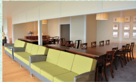
ゆったりくつろげる広縁と喫茶スペース