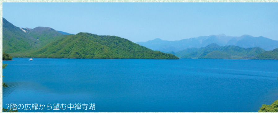
2階の広縁から望む中禅寺湖

また、併設された喫茶スペース“Tea Room 南4番 Classic”では、本場・英国から輸入した茶葉を使用した紅茶と、英国大使館のレシピで焼き上げるスコーンのセットを提供しています。「絵に描いたような風景」と評された、素晴らしい風景と併せてお楽しみください。