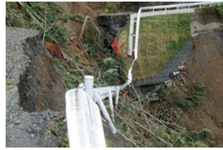
土砂崩れにより崩落した道路