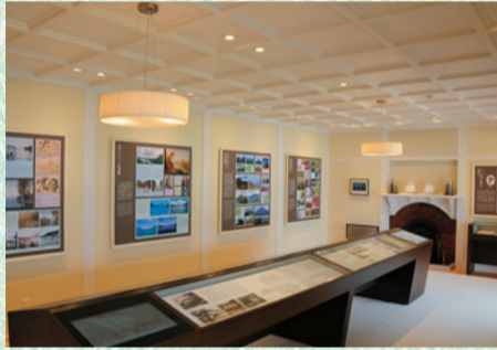
サトウが愛した奥日光を紹介

山荘は、その後、英国大使館の別荘として平成20年まで使用され、平成22年に県が譲り受け、記念公園として復元整備が行われました。館内の展示室では、奥日光をこよなく愛したサトウの生涯と、“国際避暑地・奥日光”の歴史や別荘の特徴などを紹介しています。