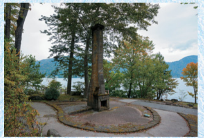
別荘跡地に静かに立つ当時の暖炉

明治中頃、中禅寺湖畔には“西六番”と呼ばれた別荘がありました。これは、“グラバー邸”で名高いスコットランド出身の貿易商、トーマス・グラバーが建てたもので、彼はここを拠点に、“英国紳士のたしなみ”とされたフライフィッシングを楽しみました。