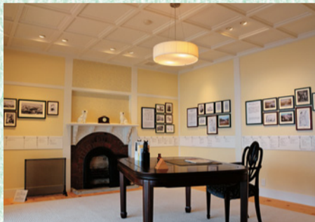
サトウの生涯について展示

旧英国大使館別荘の歴史は、英国の外交官で明治維新に大きな影響を与えたといわれるアーネスト・サトウが、明治29年に建てた山荘までさかのぼります。故郷である英国の“湖水地方”を思い起こさせる中禅寺湖の眺めに魅了されたサトウは、南岸に建てたその山荘で、趣味の登山や植物採取を楽しみました。