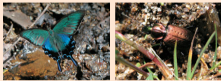
ミヤマカラスアゲハ セボシヒラタゴミムシ

森林や湿原、草原、湖沼、沢などの多様な環境がみられ、それに応じたさまざまな昆虫が生息している日光。日本の昆虫学の発展に大きな影響を与えた、イギリスの昆虫学者ジョージ・ルイスが多くの新種を発見した場所でもあります。