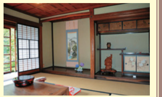
イザベラ・バードが滞在した部屋

この建物は、当時の姿のまま残されており、平成26年に国の登録有形文化財に登録され、現在「金谷ホテル歴史館」として一般公開されています。