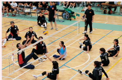
健常者も一緒に楽しめる「サウンドテーブルテニス(上)」や「シットイングバレーボール(下)」