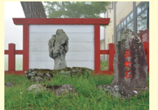
中禅寺湖畔に立つ巫女石

男体山は、これから紅葉が鮮やかな季節を迎えます。男女の隔てなく開かれた男体山へ、家族や恋人、友人と一緒に助け合いながら登ってみてはいかがでしょうか。