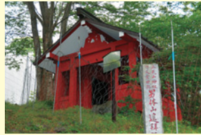
第一いろは坂に残る女人堂跡

しかし、中禅寺湖のほとりまで来たところで神罰が下ったのか、見る見るうちに体が石へと変わってしまいま