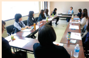
「にじいろ会」の様子

会の活動を通してお互いが刺激を受け、仕事へのモチベーションやスキルの向上につながっていると思います。その結果、会社で積極的な提案ができるようになるなど、本人のみならず、職場の活性化にもつながっていると感じますね。