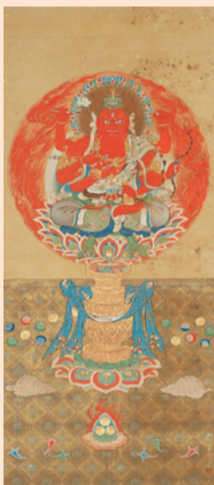
狩野梅春貞信「愛染明王像」(個人蔵)

***** 会期:1/7(土)～2/12(日) 休月曜(祝日を除く)、1/10(火) 問同館(宇都宮市) ☎028-634-1311 *****