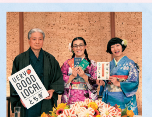
知事からのプレゼント「本物の出会い 栃木パステア」と「とちぎの百様大図鑑」を手に記念撮影

知事 地酒も温泉も栃木県の自慢ですから、ぜひよろしくお願いします！ 二人 はい、こちらこそよろしくお願いいたします！ 知事 たんぼぼのお二人が発見してくれたように、栃木県には誇れる魅力・実力がたくさんあります。“とちぎブランド”を確立させていくためには、県民一人ひとりが故郷とちぎを愛し、誇りに思う気持ちも大切です。県としても、すべての分野で「選ばれるとちぎ」を目指して、さまざまな取り組みを行っていきますので、県民の皆さまには、今年も県政運営へのご理解とご協力をよろしくお願いいたします。また、たんぼぼのお二人には、引き続き“とちぎの魅力”を発見、そして発信してほしいと思います。今日はどうもありがとうございました。 二人 ありがとうございます！