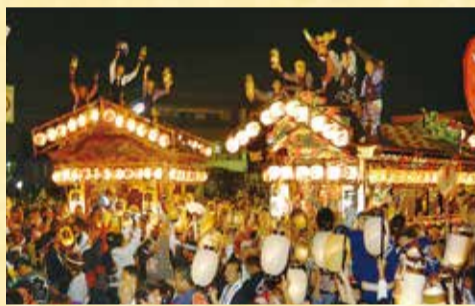
おはやしを競う「ぶっつけ」の様子