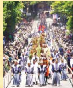
春季例大祭での百物揃千人武者行列

毎年、5月(春季例大祭)と10月(秋季大祭)に行われる、日光東照宮最大の祭事です。