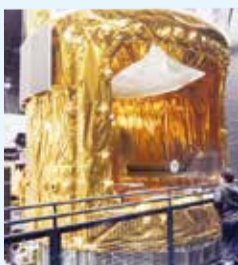
昨年度の特別体験学習の様子/筑波宇宙センター(JAXA)