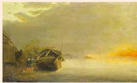
高橋由一「驟雨図」1877年頃 [栃木県立美術館蔵]

そのほか、英国最大の風景画家と称されるターナーや、近代洋画の先駆者クールベの風景画など、日本のみならず世界が憧れた名作も並びます。 また、明治時代の初期に活躍し、日本で最初の洋画家といわれる高橋由一