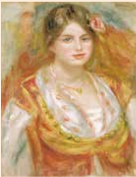
ピエール＝オーギュスト・ルノワール「マドモワゼル・フランソワ」1917年 [茨城県近代美術館蔵]

栃木県立美術館と茨城県近代美術館が所蔵する、洋画の名品の数々が一堂に会する展覧会。19世紀頃の西洋絵画から、明治・大正・昭和期の日本を代表する洋画家たちの作品まで、約100点を時代ごとに展示しています。