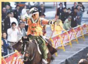
古式ゆかしい流鏝馬神事

一番の見どころは、観客の目の前で行われる流鏝馬神事。馬に乗った武者が、駆けながら的を射る姿は勇壮の一言です。