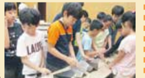
飛行機はなぜ飛ぶの/ (株)SUBARU航空宇宙カンパニー