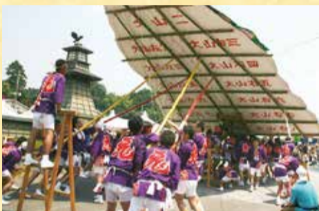
若衆たちが山をあげる場面は迫力満点

祭り最大の見せ場は、網目状に竹を組んだ木枠に烏山和紙を幾重にも貼り、その上に山水などを描いた大きな「はりか山」があがる。木頭と呼ばれる若衆の長の拍子木を合図に、100名以上の若衆が一糸乱れず「山」をあげる様は圧巻です。