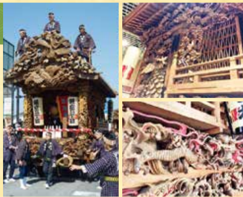
屋台に施された彫刻はまさに職人技

見どころは二十数台の屋台が練り歩いておはやしを競う「ぶっつけ」。その音色は夜まで響き、街は大いに盛り上がります。