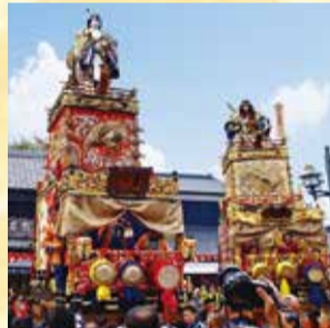
豪華な装飾が目を引く人形山車

見事な彫刻と金糸・銀糸の刺しゅうが施された、豪華絢爛な人形山車が「蔵の街とちぎ」に勢揃いする様は、「小江戸」と呼ばれていた当時の粋を感じさせてくれます。