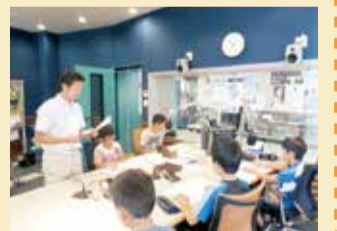
ラジオ番組はどのようにつくられるのかな/RADIO BERRY