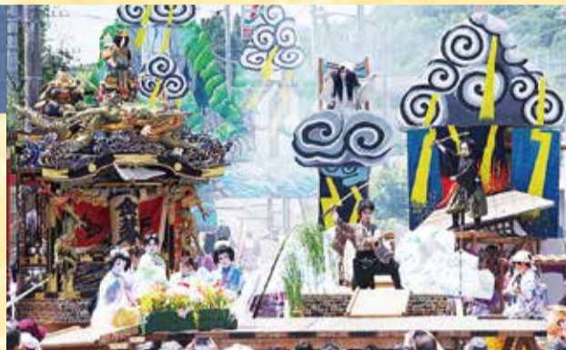
全国でも類を見ない野外歌舞伎舞踊

450年以上の伝統を誇る祭事で、毎年7月に行われます。昨年12月、「烏山の山あげ行事」の名称で、全国33の祭礼を集めた「山・鉾・屋台行事」の一つとして、ユネスコ無形文化遺産に登録されました。