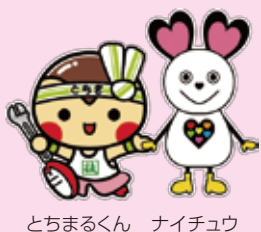
とちまるくん ナイチュウ