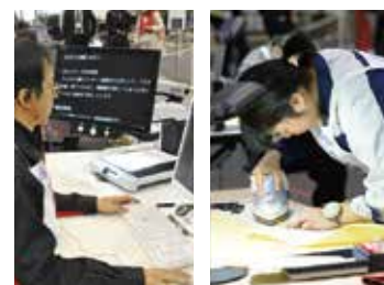
データの集計や文書作成を行う「パソコン操作職種」 裁断された生地から布製品を製作する「縫製職種」

15歳以上の障害のある方が技能を競い合うことで、職業能力の向上を目指す大会。企業を含めた社会全体に障害のある方への理解を深めてもらい、雇用の促進を図ることも目的としています。