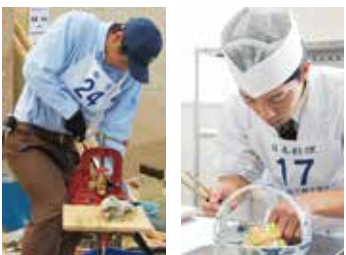
パイプを曲げたり接合したりする「配管職種」 四季の彩りを生かした伝統料理を作る「日本料理職種」

23歳以下の若者が、技能レベル日本一を競う大会。将来の日本を支える技能者を育てることや、「ものづくり」の大切さを知ってもらうことを目的に開催されます。