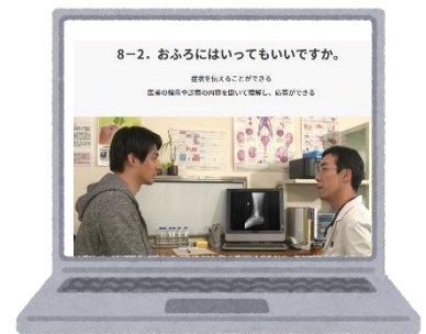
ぶんかちょうにほんごがくしゅう 文化庁日本語学習サイト