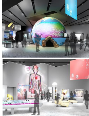
(リニューアルイメージ)

これまで科学館に来てくれてどうもありがとう。これらのおなじみの展示も12月までが最後の体験の機会。ぜひ遊びに来てね！