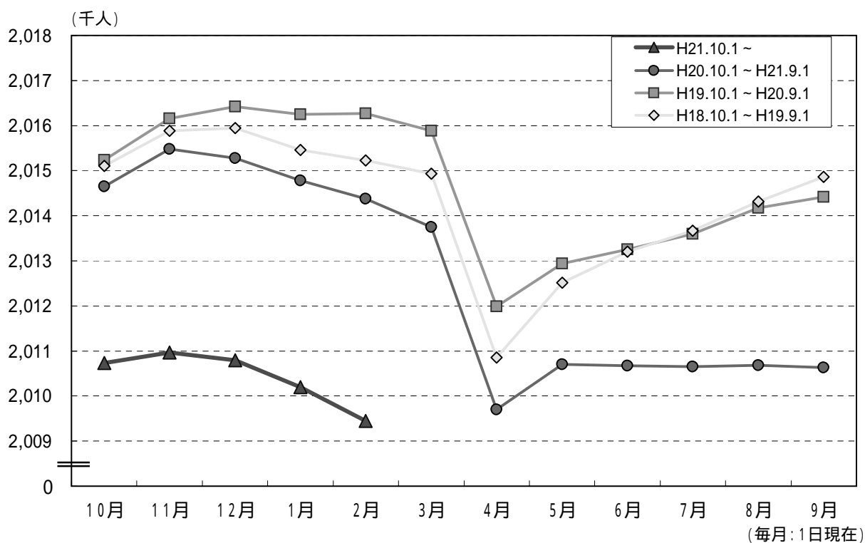
図2 自然・社会動態の推移 (平成20年1月中～平成22年1月中)