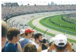
インディアナポリスのモータースピードウェイ