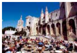
アヴィニョンにある法皇庁