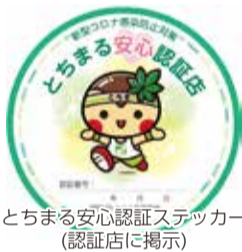
とちまる安心認証ステッカー(認証店に掲示)