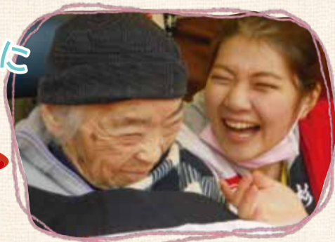
▲特別養護老人ホーム杉の樹園(市貝町)で撮影[平成28年]

すべての高齢者が自分らしい生き方を送るために、大切な役割を担っている「介護職」。団塊の世代が75歳以上になる2025年度には、県内で今よりも約5千人が必要になると推計されています。今回は、介護人材の確保と定着のための県の取組を介護現場の方々の声とともにご紹介。人と人が助け合う、温かみのある介護の現場。その温もりを感じてみませんか。