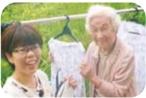
▲グループホームおおぞら(宇都宮市)で撮影[平成28年]