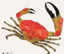
▲カニ (オーストラリアオオガニ)

森林や家の庭先など、いろいろな場所に生息し、泳いだり、歩いたり、岩にくっついたりして生活しています。