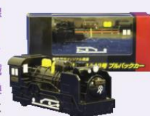
▲真岡鉄道D51ブルバックカー

「野岩鉄道会津鬼怒川線全線フリーきっぷ乗車券」「真岡鉄道D51ブルバックカー」「わたらせ渓谷鉄道一日フリーきっぷ引換券」をそれぞれ2名の方にプレゼント!