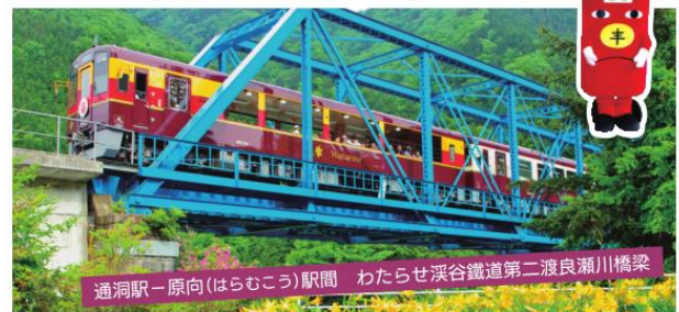
通洞駅—原向(はらむこう)駅間 わたらせ渓谷鉄道第二渡良瀬川橋梁

間藤駅 — 桐生駅 営業距離: 44.1キロ/17駅 (日光市) (群馬県桐生市)