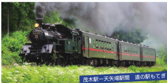
茂木駅—天矢場駅間 道の駅もてぎ

茂木駅 — 下館駅 営業距離: 41.9キロ/17駅 (茂木町) (茨城県筑西市)