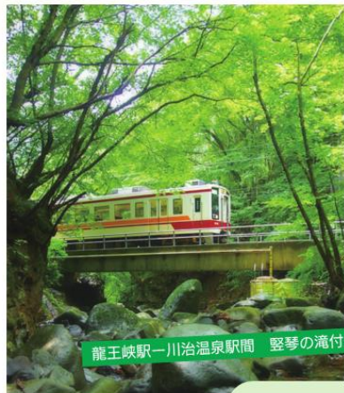
龍王峡駅—川治温泉駅間 竖琴の滝付近

新藤原駅 — 会津高原尾瀬口駅 営業距離: 30.7キロ/9駅 (日光市) (福島県南会津町)