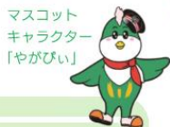
マスコットキャラクター「やがびい」

本県と福島県を結ぶ鉄道として開業。両県の旧国名の「下野国」と「岩代国」から1字ずつとり、「野岩鉄道」と名付けられました。沿線には川治温泉や湯西川温泉、塩原温泉など、自然豊かな温泉が充実。名だたる温泉に恵まれた地域を走る“ほっとスパライン”の愛称で親しまれています。