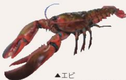
▲エビ (アメリカンロブスター)