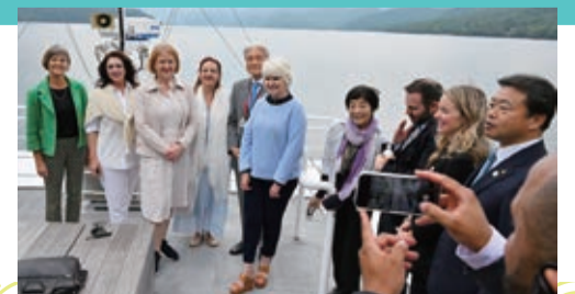
エキスカージョンの様子(中禅寺湖にて)