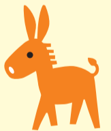
認知症サポーターキャラバンのマスコットキャラクター ロバ隊長

認知症サポーターと認知症の方、家族の支援ニーズをつなぎ、外出支援や見守り、声掛け、話し相手などさまざまな活動を行っています。