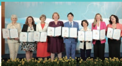
声明文を持つ大臣たち