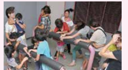
風速30メートルを超える大風体験

防災対策を行う上では、災害についてリアルなイメージを持つことが大切です。特に大きな災害の威力は、立ってられない、身動きが取れないなど、私たちの想像をはるかに超えるものです。実際に体験してみて、普段からの備えについて考えてみませんか。