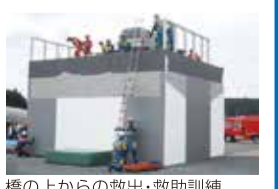
橋の上からの救出・救助訓練