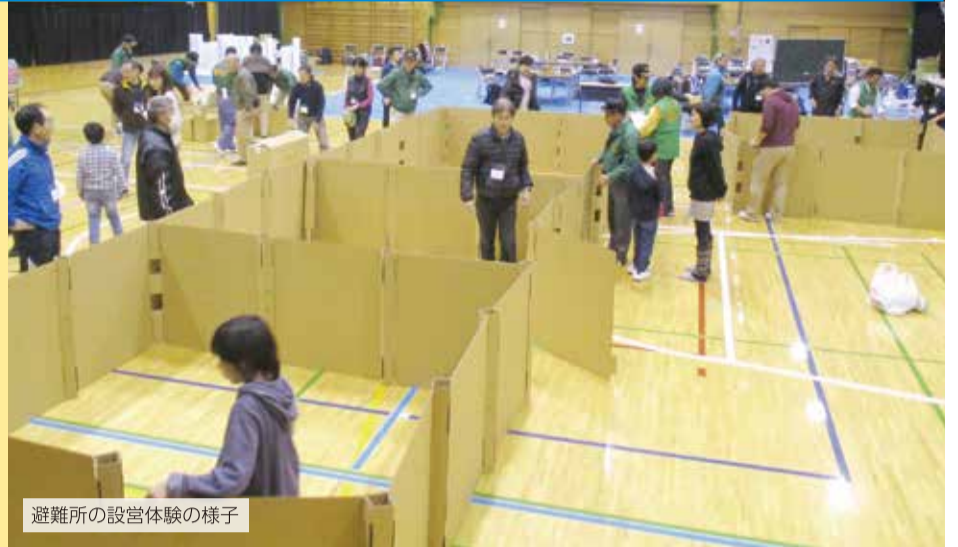
避難所の設営体験の様子

9月1日は防災の日、8月30日から9月5日までは防災週間です。地震や集中豪雨、竜巻などの自然災害は、いつどこで起こるか分かりません。いざという時に自分や家族の身を守れるよう、災害への備えについて考え、今すぐ、できることから行動に移しましょう。