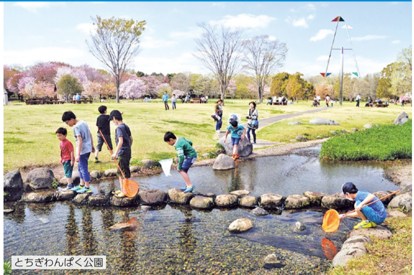
とちぎわんぱく公園

県営都市公園は、自然とのふれあいや地域コミュニティの形成、レクリエーション活動など、多様なニーズに対応した、県民の暮らしに欠かせない施設です。今回は、現在県内で開催中の大型観光企画「本物の出会い 栃木」アフターデスティネーションキャンペーン(アフターDC)の特別企画とともにご紹介します。