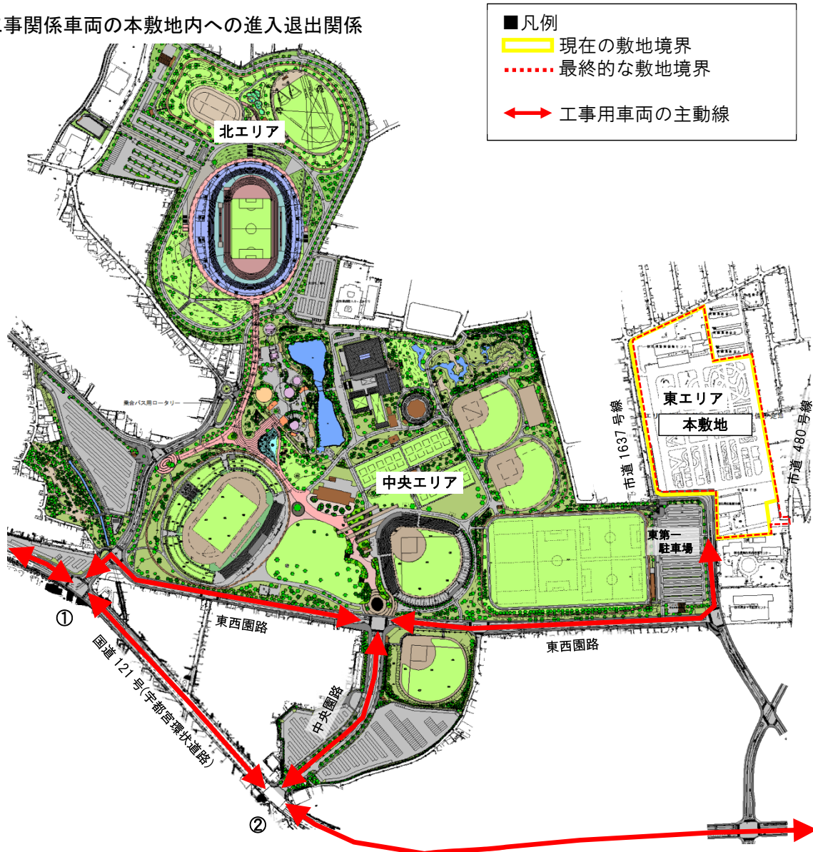
総合スポーツゾーン公園基本設計平面図

※ 工事関係車両は、国道 121 号（宇都宮環状道路）の①又は②交差点を利用し、園路（東西遠路・中央園路）、市道 1637 号線を経由の上、本敷地に進入退出すること。