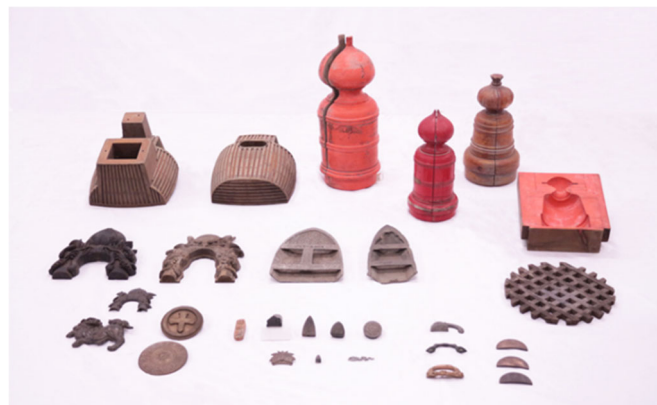
【鋳型用の各種の型】