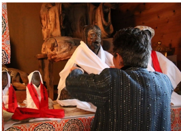
【女性たちによるお召し替え】