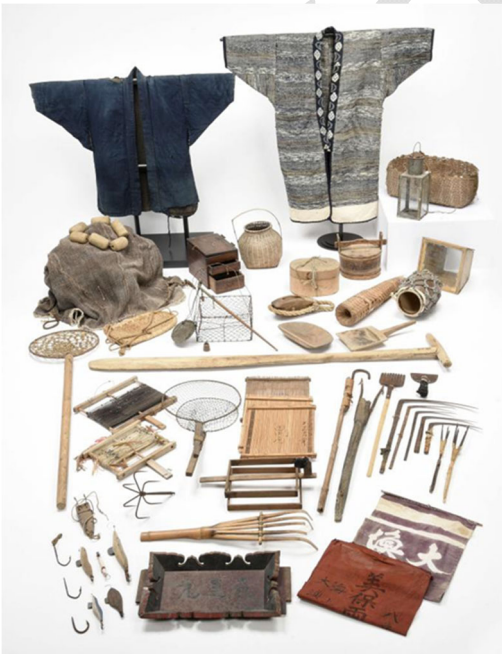
【島根半島沿岸の漁撈用具】

本件は、島根県松江市が所有する漁撈用具の収集で、リアス海岸が発達した半島北部の日本海沿岸と、半島南部の汽水湖の宍道湖、中海において、魚介類の捕獲に使用された用具である。島根半島沿岸では、複雑に入り組んだ地形のため、小型の木造船を使ったイカやブリなどの一本釣漁や網漁、磯漁などが行われ、宍道湖ではシジミ漁、中海ではアカガイ漁などが主に行われてきた。本収集は、このような松江市域の各種の漁 くり に使われた用具を中心に、漁に着用した仕事着、漁獲物の運搬や加工の用具、刳 ふね 舟形式のソリコ舟などの舟関係用具から構成される。