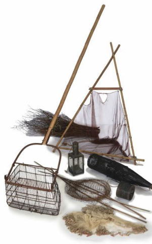
【宍道湖の漁撈用具】