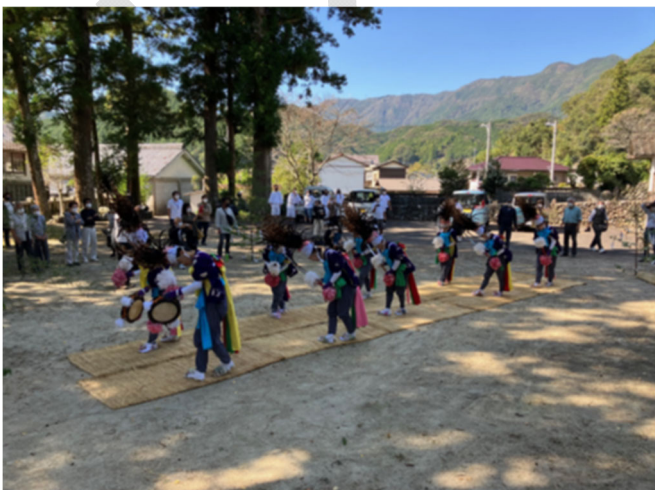
【白石地区の花取踊 列の踊り】

白石地区では11曲が伝承されている。冒頭に演じられる「庭祓い」は踊りの場の邪気を祓う演目とされ、最後の「ひけは」は退場の踊りである。この2曲は列の踊りで、踊子が一列ないし二列になって踊る。その他の曲は円の踊りで、箆を八角形に敷いて踊子が対になり、飛び跳ねつつ踊る。歌の歌詞は、概ね5・7・7・4の四句形式で、各歌の始めには念仏が付く。