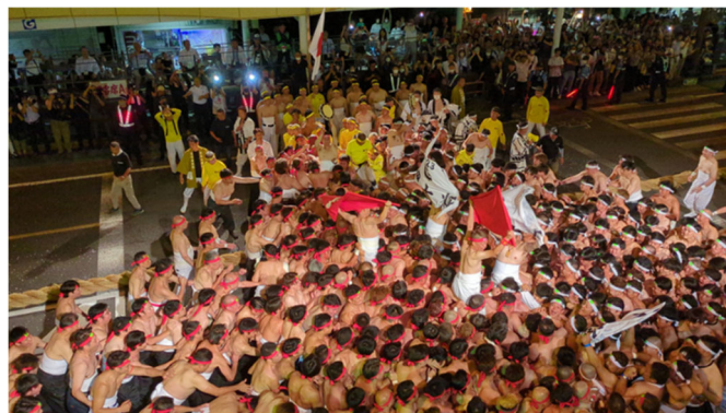
【本綱：上方と下方に分かれての綱引き】