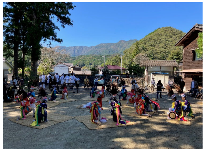
【白石地区の花取踊 円の踊り】