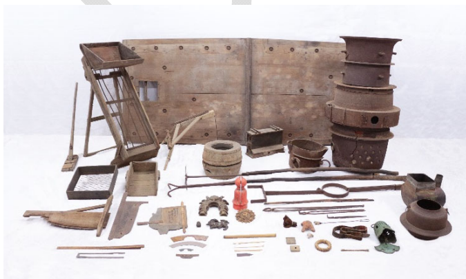
【鋳物の主な生産用具と製品】

佐野における鋳物生産の起源は、天慶年間（938～947）に遡るとされ、梵鐘や茶の湯釜、農具、生活用品など幅広い製品を鋳造しており、当地で造られた鋳物製品は、佐野の古い地名をつけて「天明鋳物」の名で広く知られている。天明鋳物の生産は、原材料の調整にはじまり、鋳型の製作、鋳型を組んで固定する型合わせ、鉄や銅などの金属材料の溶解、溶かした材料を鋳型に流し込む湯入れ、鋳型から製品を取り出す型ばらし、仕上げの各工程を経て完成となる。本件は「天明鋳物伝承保存会」と佐野市が協力し、その調査と収集を進めてきたもので、生産の各工程で使用された一連の用具が揃っており、当地で鋳造された主要な製品もあわせて収集されている。