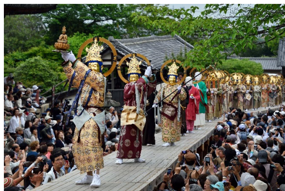
【来迎橋を渡る菩薩たち】