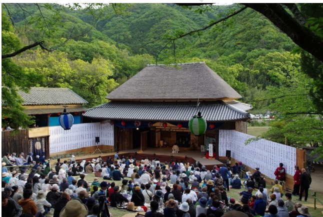
【肥土山農村歌舞伎】

両地区とも必ず「 さんばそう 三番叟」で幕をあげ、舞台を浄める。伝承演目は義太夫狂言が多く、「 かなでほんちゆうしんぐら 仮名手本忠臣蔵」「 えほんたいこうき 絵本太功記」等の時代物のほか、世話物、また純歌舞伎も演じられ、狂言立ては「三番叟」含め毎年3、4番ほどである。小豆島の歌舞伎には、幕末以降、上方歌舞伎の芸を身につけた役者たちが来島・居住して指導した。そのため、演技・演出には、今なお上方歌舞伎の特徴がうかがわれる。また棧敷割りのしきたり等、地域的な伝統も保持している。