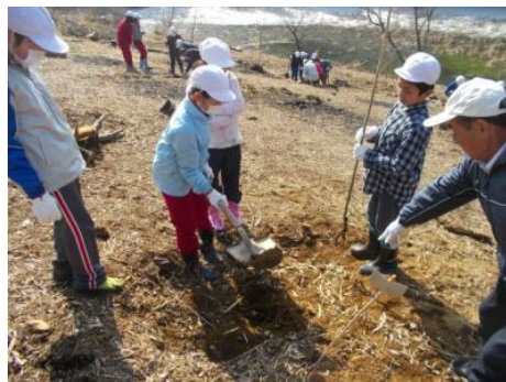
益子小学校附属施設建築への町産材の利用をきっかけとした、植樹体験教室に対し支援しました。（益子町城内）