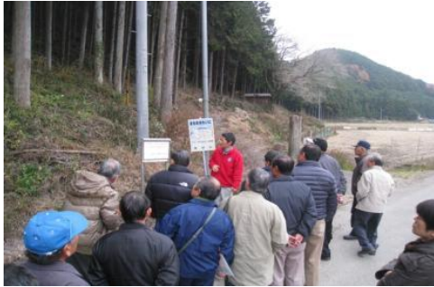
バスツアーを実施しました。 (鹿沼市)

パンフレットの作成・配布、テレビ・ラジオでの広報、税事業実施箇所を県民の皆さんにご覧いただくバスツアーなどを実施しました。