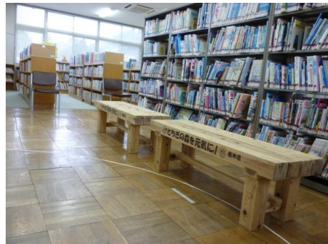
木製ベンチの使用状況 （那須烏山市烏山図書館）