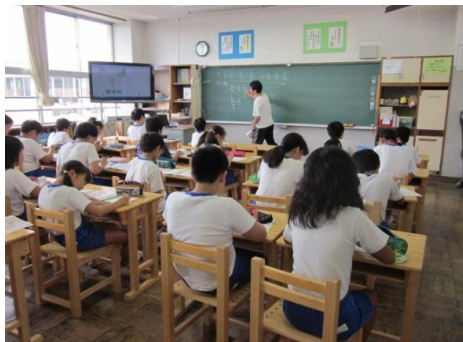
木製学習用机・椅子の使用状況 （宇都宮市立錦小学校）