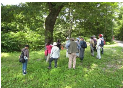
初夏の森を観察しました。 (矢板市県民の森)