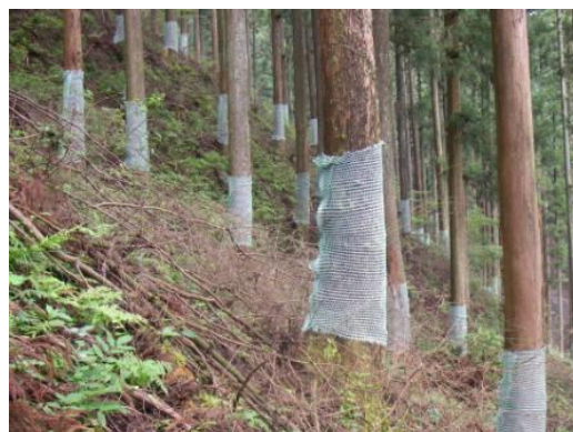
樹木に被害防止資材を巻き付けました。