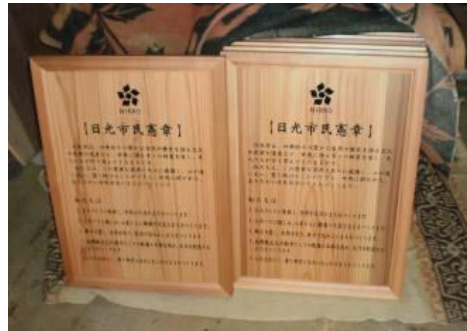
市民憲章パネルの作成・設置 （日光市）