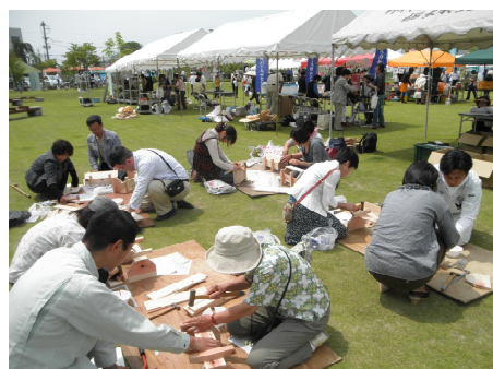
木工教室を実施しました。 （県民の日イベント:県庁前広場）