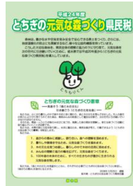
普及啓発用パンフレットを作成しました。