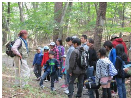
森づくり体験活動を実施しました。 （森づくりの日記念イベント:那須塩原市内）