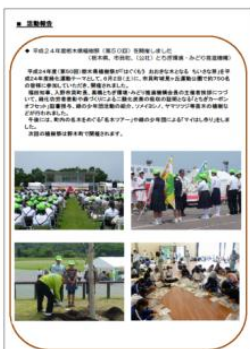
グリーンウェーブ