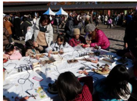
森林にふれあうイベントが開催されました。 (日光市)