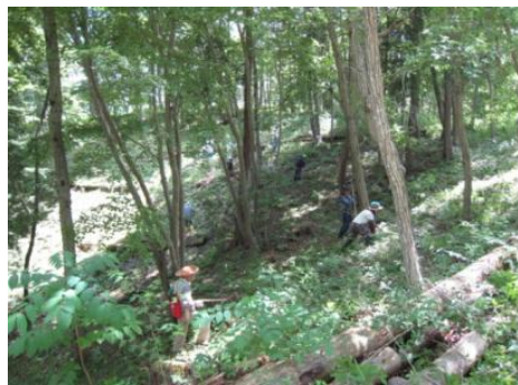
下刈体験を実施しました。 (益子町益子の森)