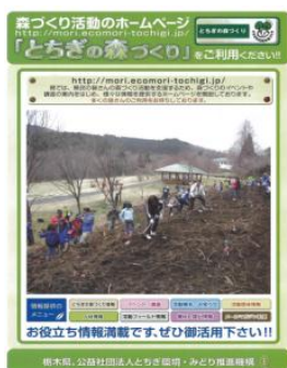
ホームページ「とちぎの森づくり」 周知チラシ