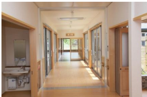
特別養護老人ホームの内装木質化 （茂木町）

公共施設等の木造・木質化（4市町）、奥山林間伐材及び里山林整備により発生した間伐材の有効利用促進（3市町）、木工教室など地域での木の良さ普及啓発等（14市町）を支援しました。