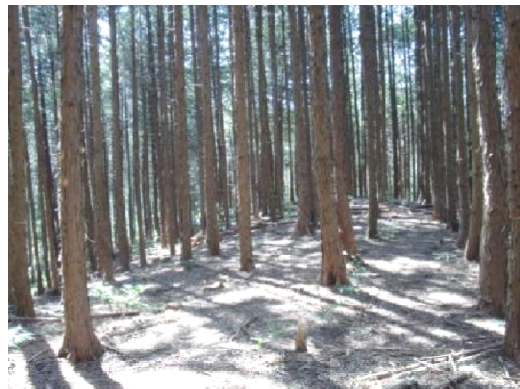
間伐を実施した結果、陽光が地表まで差し込むようになりました。