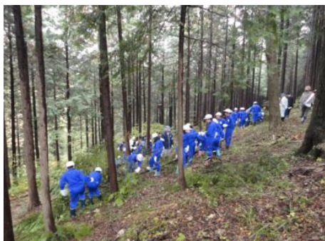
森林体験として育樹活動が行われました。 (那須烏山市)