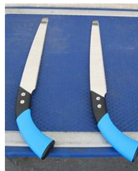
貸出機材 (枝打ち用ノコギリ)