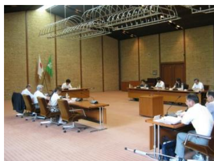
報告書取りまとめ（栃木県公館）