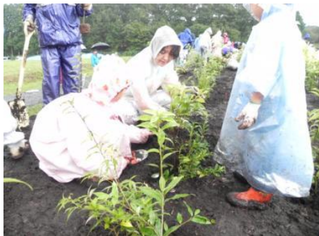
市民協働による埋立地跡地への植樹活動に対し支援しました。 （宇都宮市もったいないの森長岡）