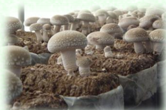
菌床栽培しいたけ

しかし、安全な栽培方法の研究・普及など放射性物質対策を進めてきた結果、出荷制限の一部が解除されてきており、対策の効果が着実に表れてきています。