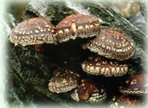
原木栽培しいたけ