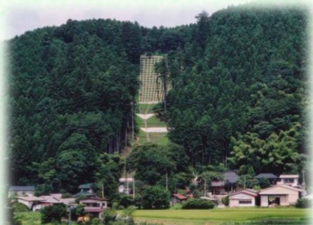
土砂流出防備保安林（那須町）

保安林には、土砂の流出を防ぐ「土砂流出防備保安林」、雨を貯えて洪水や濁水を防ぐ「水源かん養保安林」など、その種類に応じて様々な役割があります。