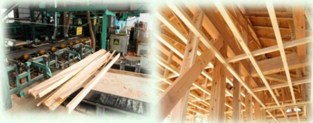
製材工場（那須塩原市）

主にスギやヒノキなどの針葉樹林から、家を建てるための柱や梁（はり）などが生産されています。