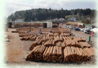
木材共販所（矢板市）