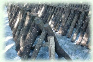
原木栽培しいたけのほだ木（芳賀町）