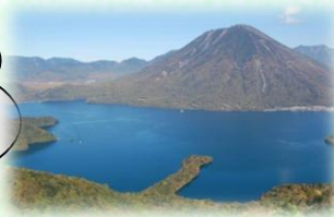
日光国立公園（日光市）