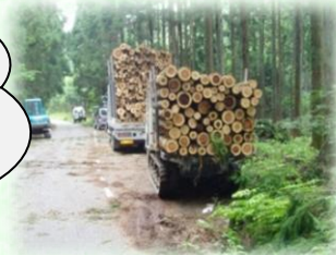
山から運び出される丸太（矢板市）