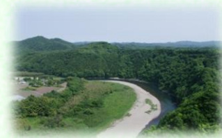
那珂川県立自然公園（茂木町）