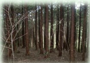
奥山林の間伐（矢板市）

皆様のご理解、ご協力のもと、ご負担いただいたとちぎの元気な森づくり県民税（個人：年額700円、法人：均等割額の7%）を活用し、県民協働による元気な森づくりを進めています。