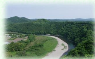
那珂川県立自然公園 （茂木町）