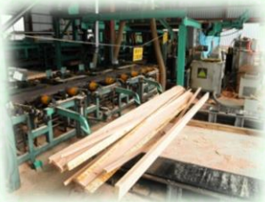
製材工場（那須塩原市）

主にスギやヒノキなどの針葉樹林から、家を建てるための柱や梁（はり）などが生産されています。