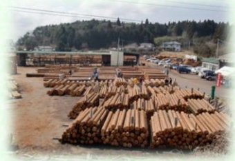
木材共販所（矢板市）