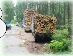
山から運び出される丸太（矢板市）