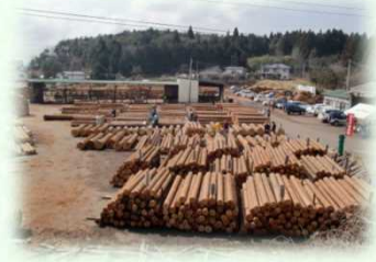
木材共販所（矢板市）