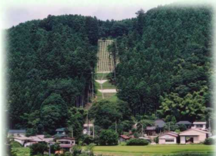
土砂流出防備保安林（那須町）

保安林には、土砂の流出を防ぐ「土砂流出防備保安林」、雨を貯えて洪水や濁水を防ぐ「水源かん養保安林」など、その種類に応じて様々な役割があります。