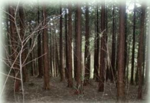
奥山林の間伐（矢板市）

皆様のご理解、ご協力のもと、ご負担いただいたとちぎの元気な森づくり県民税（個人：年額700円、 法人：均等割額の7%）を活用し、県民協働による元気な森づくりを進めています。