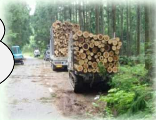
山から運び出される丸太（矢板市）