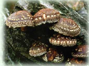
原木栽培しいたけ