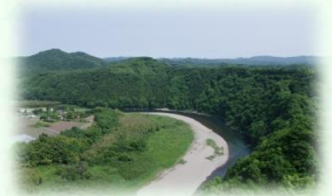
那珂川県立自然公園 （茂木町）