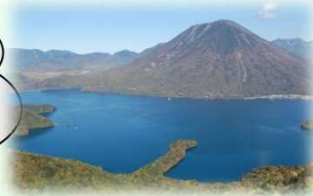
日光国立公園（日光市）