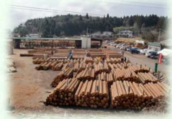
木材共販所（矢板市）