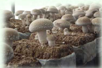
菌床栽培しいたけ

しかし、安全な栽培方法の研究・普及など放射性物質対策を進めてきた結果、出荷制限の一部が解除されてきており、対策の効果が着実に表れてきています。