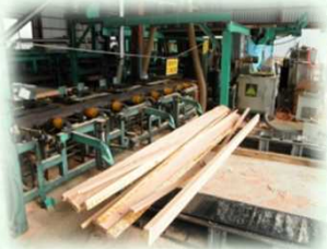
製材工場（那須塩原市）

主にスギやヒノキなどの針葉樹林から、家を建てるための柱や梁（はり）などが生産されています。