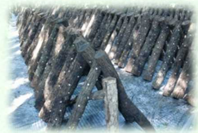
原木栽培しいたけのほだ木（芳賀町）