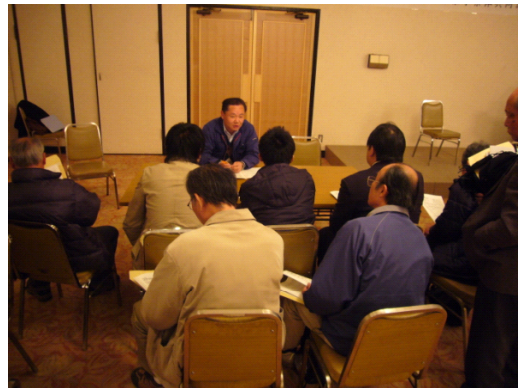
個別事業者との質疑応答

参加者の平均年齢は、第1回目が38.2歳、第2回目が44.4歳でした。これらの皆さんが4月から始まるとちぎの元気な森づくり県民税による森林整備事業が計画的に行われるよう期待しています。