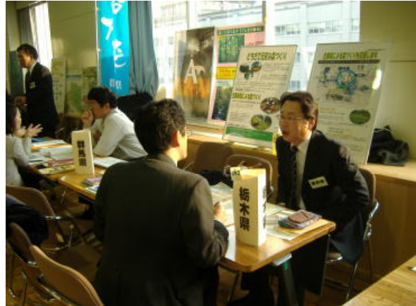
企業の相談に応じる県担当者

（CSR = Corporate Social Responsibilityの略）