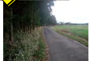
地域の安全安心のための 里山林整備（那須塩原市）