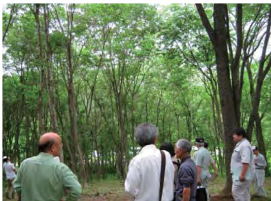
里山林整備事業の実施箇所を調査する委員

とちぎの元気な森づくり県民税により実施する事業の透明性・公平性を確保するとともに、事業の推進に必要な事項を検討するため、とちぎの元気な森づくり県民税事業評価委員会を設置しています。