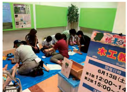
真剣に釘を打つ子ども達

完成後、親子で協力しながら作製したプランターを、子どもが大事そうに抱えて帰る姿が印象的でした。