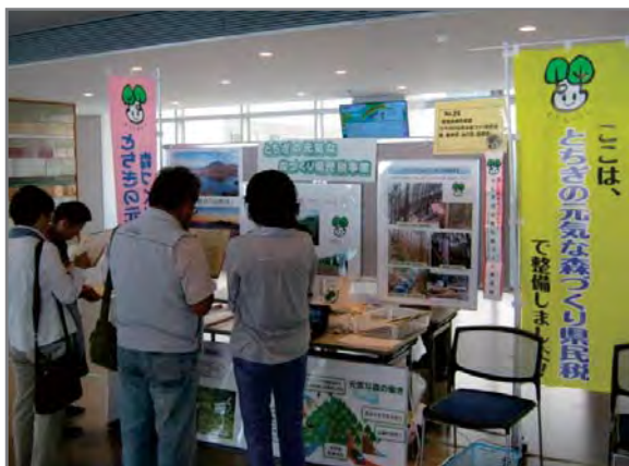
パネルを展示したり、 県民税事業紹介DVDを放映しました。