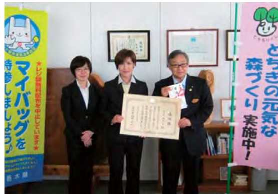
—感謝状贈呈式（株式会社カスミ様）— 有料化しているレジ袋の販売収益金をご寄附いただきました。

皆様から頂きましたご寄附は、「とちぎの元気な森づくり県民税」と合わせて、荒廃した奥山林や身近な里山林の整備、森林ボランティアの支援や森林・森づくりの大切さの理解促進を図る取組などに、大切に使用させていただきます。