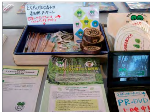
アンケートにご協力いただいた方に、とちもり くんグッズを配布。木製コースターが人気!

6月15日（月）の「県民の日記念イベント」において、とちぎの元気な森づくりに関するパネルの展示、県民税についてのアンケートを実施しました。