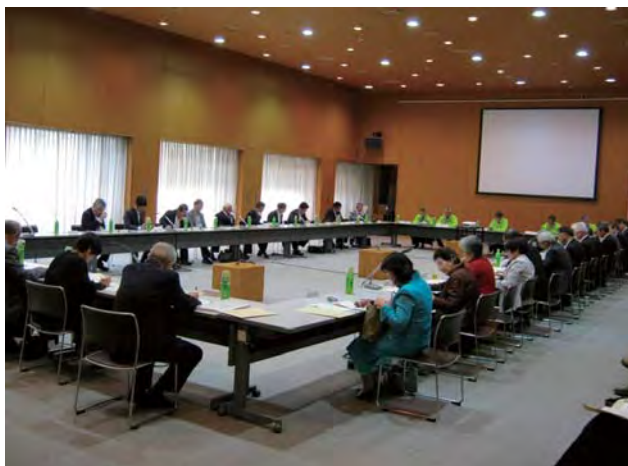
総会会場（総合文化センター）