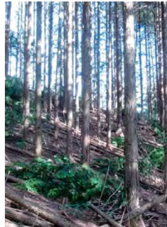
←間伐して整備された森 （宇都宮市）

平成20年度から平成26年度までの7年間で、約22,300ヘクタールの奥山林を整備しました。（全体整備目標：30,900ヘクタール）