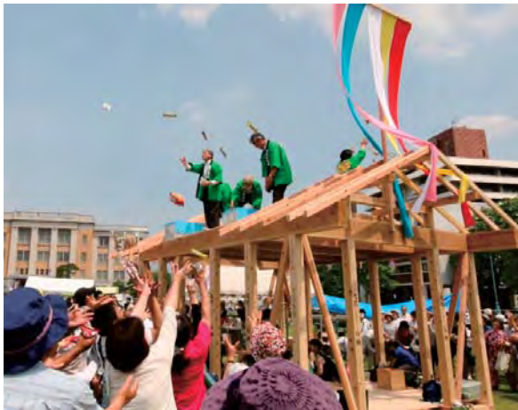
「こっちにも投げてー！」と大興奮の参加者

「模擬上棟式」が始まる前から多くの方が、とちぎ材で建てた躯体の周りに集まり、知事らがお菓子をまくと、大きな歓声と共に手を大きく広げ夢中になってお菓子を拾っていました。