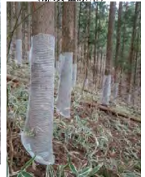
↓ 獣害防止資材の巻き付け （那須塩原市）