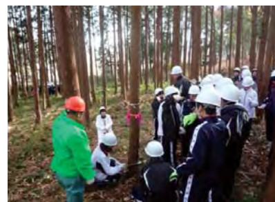
森林整備体験学習(佐野市)

市や町が行う、市民やボランティアを対象とした森づくり活動、子どもたちの森林環境学習などを支援します。【活動数:424】