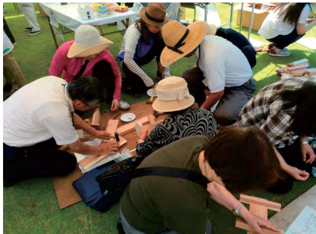
恒例の木工教室も大盛況!