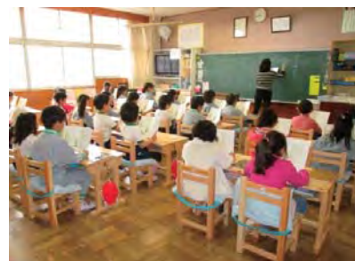
学習用机・椅子の配布(下野市祇園小学校)

奥山林整備で発生した間伐材を、小中学校に配布する学習用机・椅子の製作に活用するほか、日光杉並木保護のための木柵としても活用します。 【机・椅子12,900基、木製ベンチ2,000基】