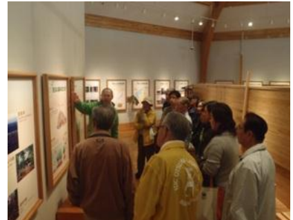
創造の森交流館にて森林の公益的機能等について学習いただきました