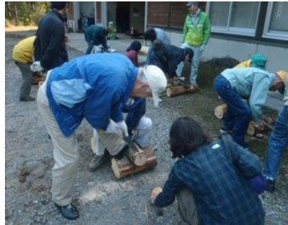
丸太切り体験をする参加者