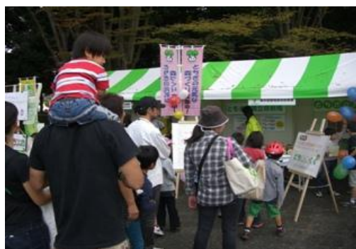
行列ができるほどの人気ぶり！

11月5日（土）及び6日（日）に、「スポレク“エコとちぎ”2011」の祭典会場（栃木県総合運動公園）において、「パネル展示」をはじめ、「とちもりくんクイズ」や「グッズ」、「パンフレット」の配布を行いました。