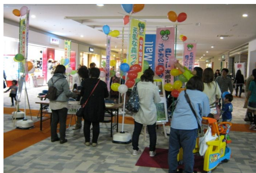
多くの皆様にお越しいただきました

10月22日（土）、宇都宮市内の大型商業施設「ベルモール」にてパネル展示やパンフレットの配布のほか、アンケートを行い、ショッピングなどの合間に多くの方々にお越しいただき、アンケートに御協力いただきました。