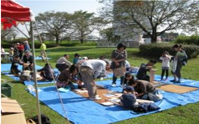
木づかいスタッフさん協力のもと、多くの皆様に 参加いただきました

10月8日（土）～9日（日）に開催された「エコ・もりフェア2011」で、木工教室を実施しました。