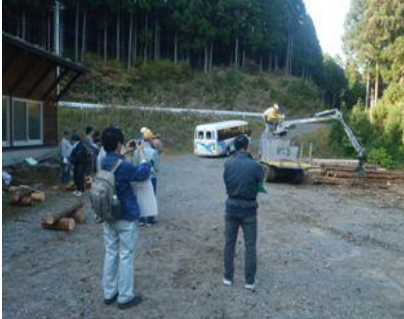
フォワーダの操作にチャレンジ！

10月29日（土）～30日（日）にかけて、鹿沼市入栗野の県21世紀林業創造の森及び上粕尾地内の森林において、墨田区から18名の方に参加いただき、高性能林業機械の操作体験や丸太切り体験、間伐体験などを行い、「とちぎの元気な森づくり」への理解を深めていただきました。