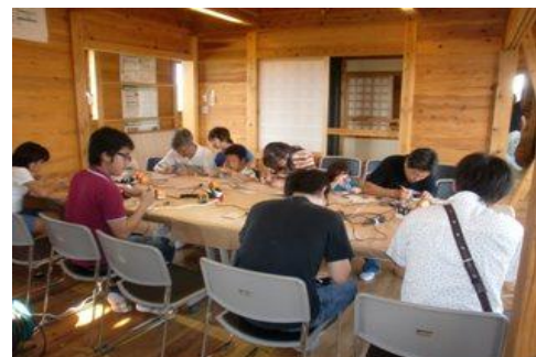
マイはし作りにもチャレンジ！