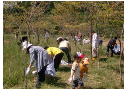
下刈り体験を行う参加者

9月10日（土）、矢板協働の森（シャープの森IN矢板）等において、都内等に勤務するシャープ株式会社社員及び御家族の皆様20名のほか、同社矢板AVシステム事業本部社員及び御家族の皆様に参加いただき、下刈り体験や木工教室などを行い、「とちぎの元気な森づくり」への理解を深めていただきました。