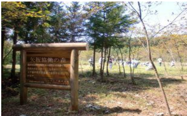
下刈り体験の会場の矢板協働の森