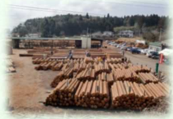
木材共販所（矢板市）