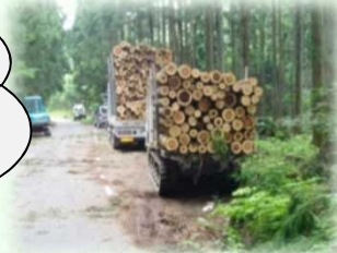
山から運び出される丸太（矢板市）