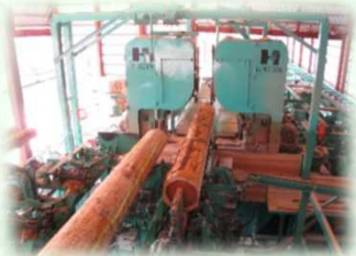
製材工場（那須塩原市）

主にスギやヒノキなどから、家を建てるための柱や梁（はり）などが生産されています。