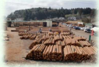
木材共販所（矢板市）