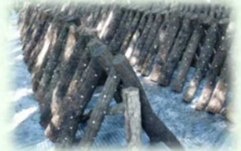
原木しいたけのほだ木（芳賀町）