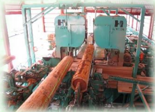
製材工場（那須塩原市）

主にスギやヒノキなどの針葉樹林から、家を建てるための柱や梁（はり）などが生産されています。