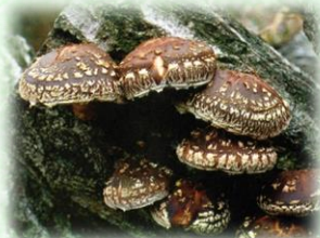
原木栽培しいたけ