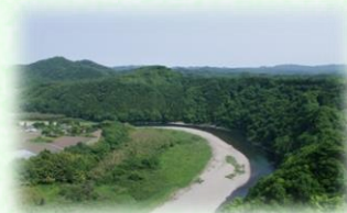
那珂川県立自然公園 (茂木町)