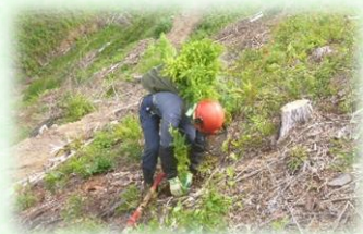
小花粉スギコンテナ苗の植栽

皆さんの御理解、御協力のもと、ご負担いただいたとちぎの元気な森づくり県民税（個人：年額700円、法人：均等割額の7%）を活用し、県民協働による元気な森づくりを進めています。H30（2018）年度からは、森林の若返りのため、皆伐後の植栽の支援等に取り組んでいます。