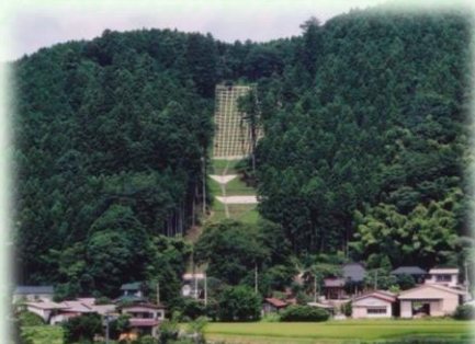
土砂流出防備保安林（那須町）

保安林には、土砂の流出を防ぐ「土砂流出防備保安林」、雨を貯えて洪水や濁水を防ぐ「水源かん養保安林」など、その種類に応じて様々な役割があります。