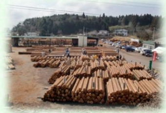
木材共販所（矢板市）