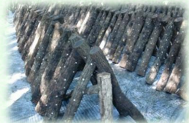
原木栽培しいたけのほだ木（芳賀町）