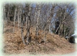
里山林の整備 (芳賀町)

令和元(2019)年度は、 皆伐後の植栽 374ha 里山林の整備 772ha 地籍調査 278ha などの事業を実施しました。