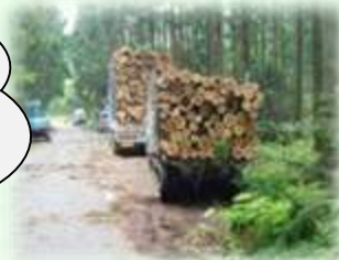
山から運び出される丸太（矢板市）