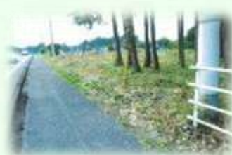
通学路周辺の整備 （日光市）

令和3(2021)年度は、 皆伐後の植栽 341ha 里山林の整備 958ha 地籍調査 816ha などの事業を実施しました。