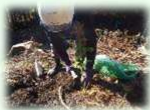
少花粉スギコンテナ苗の植栽 （日光市）

皆さんの御理解、御協力のもと、御負担いただいたとちぎの元気な森づくり県民税（個人：年額700円、法人：均等割額の7%）を活用し、県民協働による元気な森づくりを進めています。とちぎの元気な森づくり県民税はH20(2008)年度から導入され、長年手入れされていなかった森林の整備等を進めてきました。H30(2018)年度からは、森林の若返りのため、皆伐後の植栽の支援等に取り組んでいます。