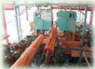
製材工場（那須塩原市）

主にスギやヒノキなどから、家を建てるための柱や梁（はり）などが生産されています。