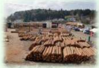
木材共販所（矢板市）