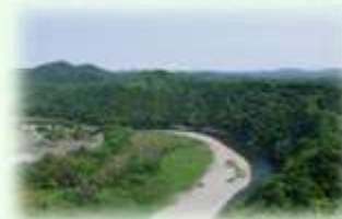
那珂川県立自然公園 （茂木町）