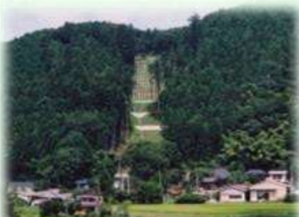
土砂流出防備保安林（那須町）

保安林には、土砂の流出を防ぐ「土砂流出防備保安林」、雨を貯えて洪水や濁水を防ぐ「水源かん養保安林」など、その種類に応じて様々な役割があります。