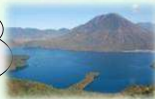
日光国立公園（日光市）