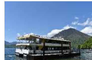
大使館別荘記念公園棧橋