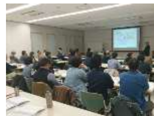
自然ガイド等外国人対応力向上研修