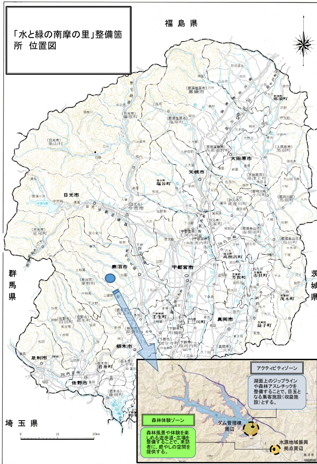
図 3 本施設の位置図