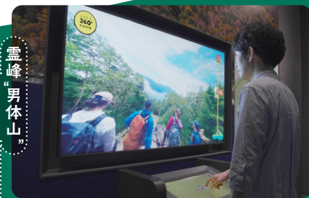
霊峰「男体山」 絶景を求めて登拝