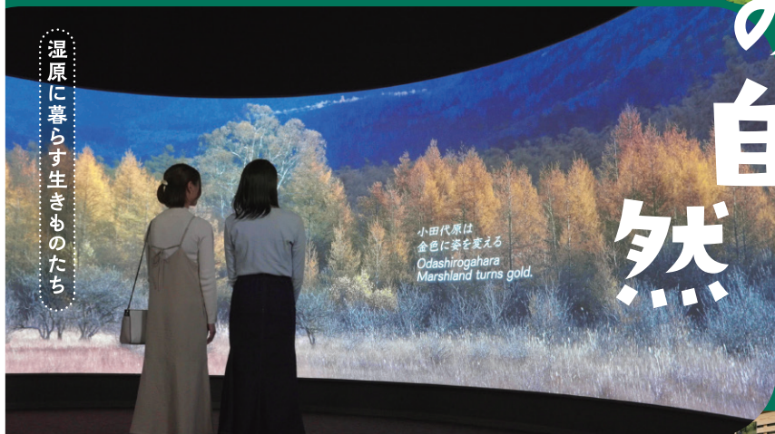
湿原に暮らす生きものたち