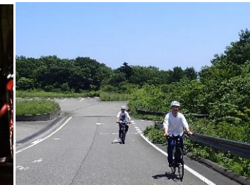
Eバイクセルフガイドツアー