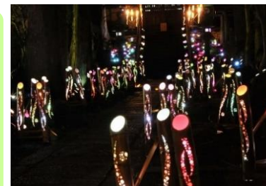
竹取物語ライトアップイベント