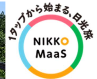
NIKKO MaaS ロゴ