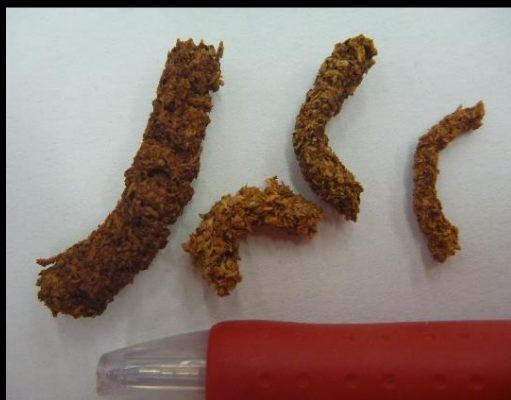
木くずと幼虫の糞が固まって かりんとう状となる