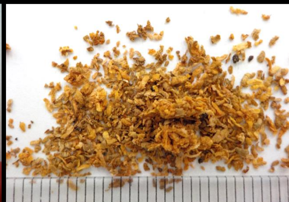
フラスの内容物にはノミで削ったような 薄い木くず片が含まれている