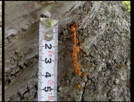
サクラの幹から排出されるフラス