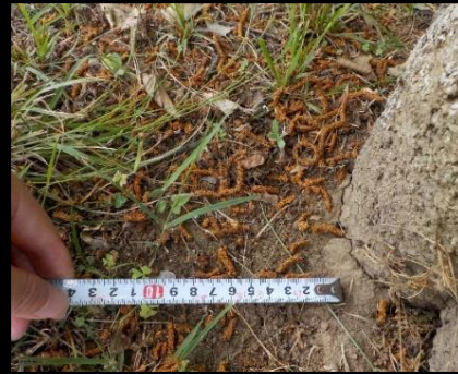
サクラの根元に落下したフラス