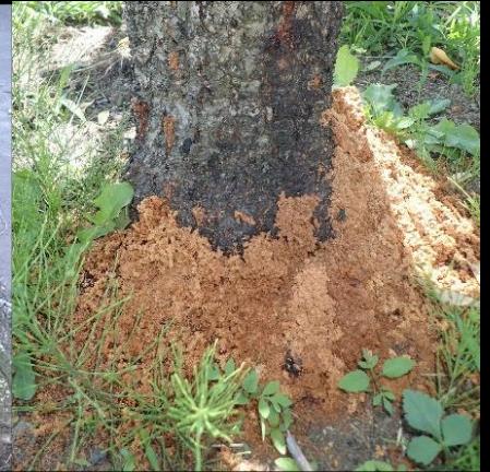
赤茶色のフラスが株元に積もったサクラ(左)とモモ(右)