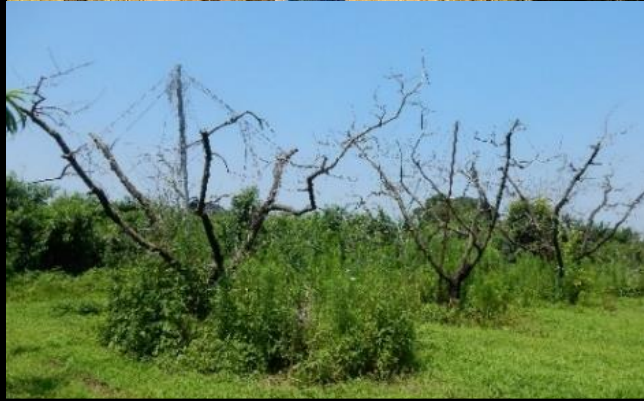
被害で枯死した公園のサクラ(上)と果樹園のモモ(下)