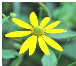
オオハンゴンソウ

日光国立公園内である奥日光地域では、オオハンゴンソウをはじめとした外来植物が広範囲に繁殖し、在来植物の植生が脅かされているため、昭和51年から多くのボランティアの協力により除去作業を実施してきました。しかし、外来植物の繁殖力はとても強いため、継続した除去作業が必要になります。