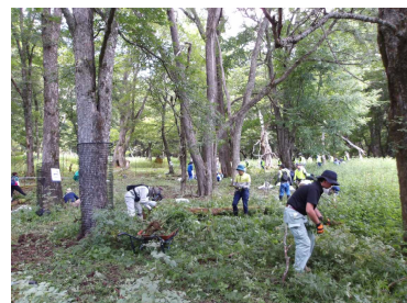
昨年度の除去作業の様子