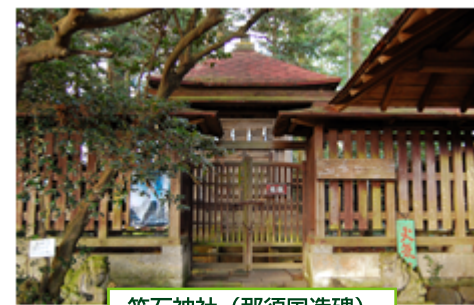
笠石神社(那須国造碑)

那珂川の自然を生かした、楽しく学べる公園。水族館では那珂川に棲む魚を中心に、日本の淡水魚、世界の淡水魚など約230種、60000尾を見ることができる。休園日(毎週月曜日)は園内に入ることができないので注意。