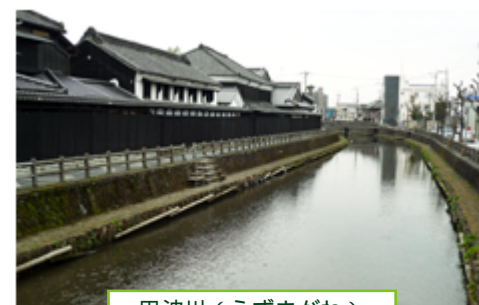
巴波川(うずまがわ)

栃木市は、江戸から明治にかけて商業の町として発展し、県庁所在地でもありました。市の中心部を流れる巴波川沿いには、かつての宿場町としての町並みが残されており、多くの蔵が建ち並んでいます。