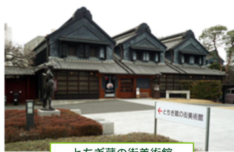
とちぎ蔵の街美術館

栃木市は、江戸から明治にかけて商業の町として発展し、県庁所在地でもありました。市の中心部を流れる巴波川沿いには、かつての宿場町としての町並みが残されており、多くの蔵が建ち並んでいます。