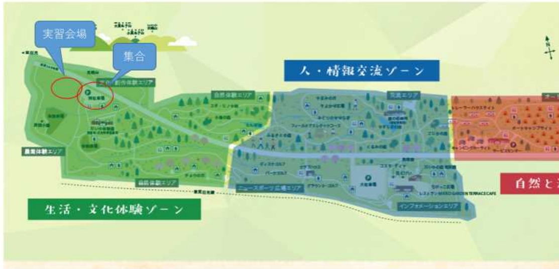
【日光だいや川公園案内図】